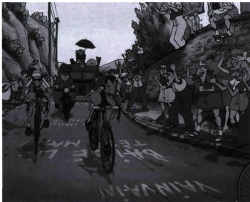
Le Tour de France de Champion

Le regard tendre et doucereux que pose Chomet sur ses Triplettes... peut faire regretter le ton plus caustique et résolument adulte de la Vieille Dame et les pigeons ou de sa série d'albums Léon la came . Mais il y a des parallèles à établir entre les univers de ces trois œuvres. Dans les trois cas, l'auteur nous met en présence d'un grand dadaïste sans défense, qui se retrouve dans de sales draps; c'est une mémé astucieuse qui, chaque fois, vient à sa rescousse. Ainsi, l'auteur semble affectionner les anti-héros. Par ailleurs, afin de peaufiner l'intrigue, le réalisateur a puisé ses influences chez des cinéastes comme Tati, Keaton et Buñuel. Si l'influence des deux premiers semble évidente, celle de Buñuel surprend. Selon Chomet, Buñuel est «quelqu'un qui met toujours en porte à faux, en déséquilibre. Il faut énormément participer dans ses films. Je cherche à faire pareil. J'essaie toujours de trouver le comique dans des situations désespérées» 2 .