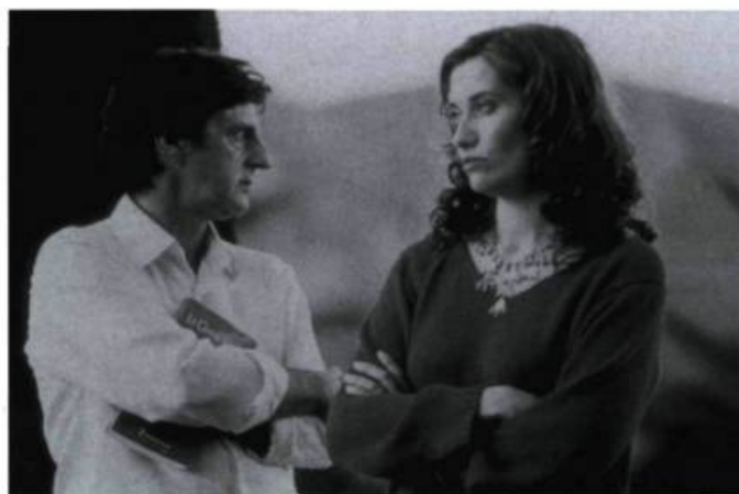
Daniel Auteuil et Emmanuelle Devos dans L'Adversaire

C'est sur ce fragile équilibre que s'est construit L'Adversaire , ouvrage que les amateurs de biographies croustillantes se plairont à détester. L'auteur s'attarde autant à décortiquer la pénible mise en chantier de son livre qu'à chercher à faire toute la lumière sur un drame dont le sens ne cesse de se dérober à lui. Pourtant, les relations difficiles de Romand avec ses parents de condition très modeste, sa personnalité diaphane — avant le triste soir du 8 janvier 1993, l'homme a passé son existence... à passer inaperçu —, ses errances dans les bois, les stationnements et les restaurants entre la petite localité de Ferney en France, où il habite, et Genève, là où est situé le siège social de l'OMS, les détails du massacre, ceux du célèbre procès, tout y est, décrit avec sensibilité, sans voyeurisme. Mais Carrère ramène sans cesse le lecteur à ses doutes, à ses questionnements sur la véritable clé qui permettrait de comprendre la personnalité de