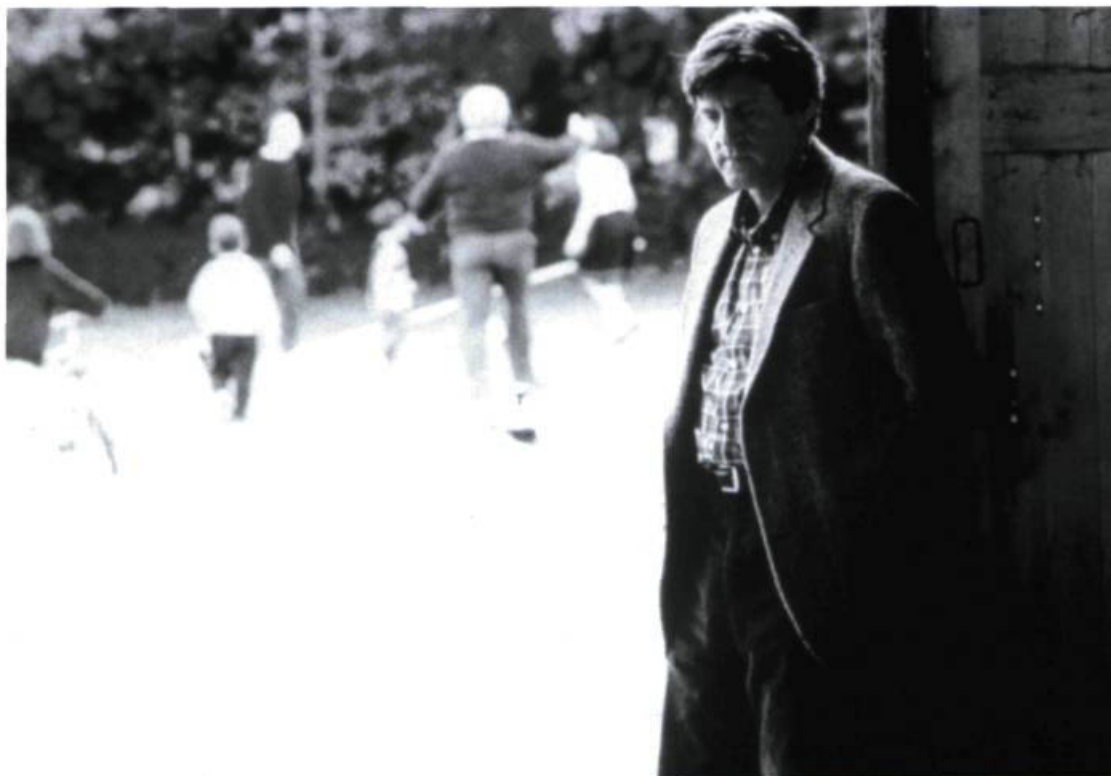
Daniel Auteuil dans L'Adversaire

le but de maintenir l'écart nécessaire, Romand est devenu Jean-Marc Faure, mais la cinéaste voulait marquer son territoire avec plus de force: «J'ai longtemps pensé attribuer le rôle de Jean-Marc Faure à un acteur inconnu. Mais, comme je désirais absolument ancrer cette histoire dans un cadre fictionnel, j'ai au contraire décidé de retenir un acteur avec lequel le public entretient une intense familiarité. Cela servait la proximité que je voulais instaurer entre le personnage et le public. À partir de là, le choix de Daniel Auteuil s'est imposé naturellement 4 .»