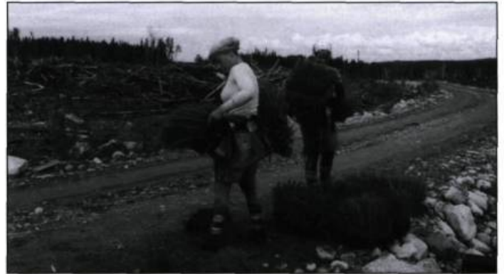
2000 Fois par jour de Stéphanie Lanthier et Myriam Pelletier-Gilbert

Le premier long métrage de Jeremy Peter Allen, Manners of Dying , film d'ouverture des prochains Rendez-vous du cinéma québécois, pose des questions éthiques sur la peine de mort. Adapté d'une nouvelle de Yann Martel, le film suit les dernières