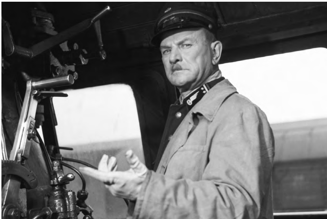
Un homme sur la voie

avec vous.» Pas de place pour le déterminisme historique dans la proposition de Kieslowski, qui n'offre aucun éclaircissement à la reprise du récit: à intervalles réguliers, l'histoire recommence, sans recourir à un procédé formel particulier. Prototype du jeune homme ordinaire, Witek se trouve ainsi balloté d'un extrême à un autre, incarnant à lui seul les trois choix possibles du Polonais de cette époque: participer au système, se rebeller contre lui ou, comme la majorité silencieuse, tenter de vivre une vie à peu près normale malgré tout. De plus, le film se distingue par son sombre pessimisme. En faisant brutalement mourir son personnage à la fin de la troisième version de l'histoire (qui apparaissait pourtant la plus « positive »), Kieslowski prend position contre l'immobilisme politique et offre une vision désenchantée de l'existence humaine.