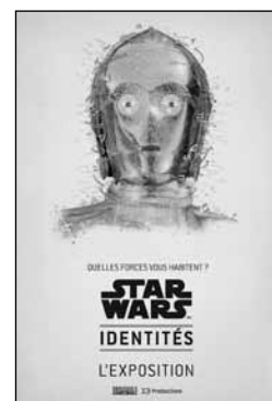
Star Wars MC Identités Au Centre des sciences de Montréal, jusqu'au 16 septembre 2012