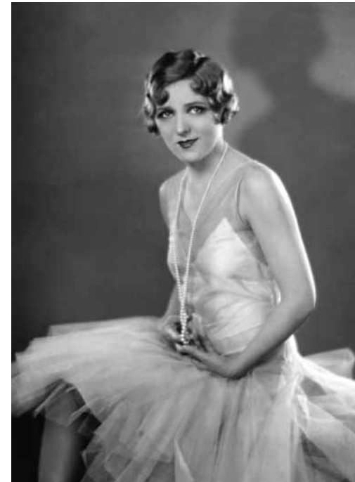
Mary Pickford dans Coquette (1929)