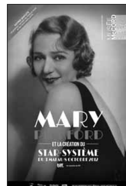
Mary Pickford et la création du star-système Au Musée McCord, jusqu'au 8 octobre 2012

Art démocratique par excellence, le cinéma, qu'il soit muet ou de science-fiction, conserve cette aura magique capable de drainer des néophytes au Musée McCord ou au Centre des sciences. En cela, le septième art y méritera toujours sa place. Les étoiles passent, la fascination demeure. ▀