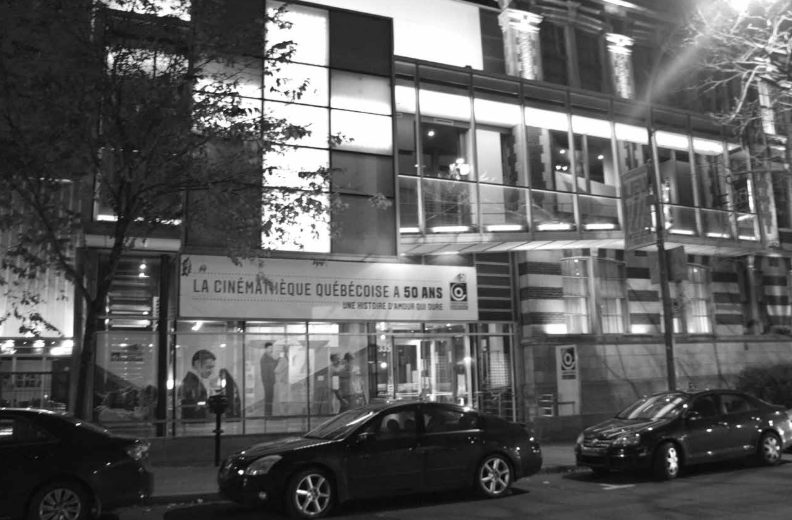
La façade de la Cinéma-thèque québécoise, sur le boulevard De Maisonneuve à Montréal, est resplendissante en soirée grâce, entre autres, à une œuvre lumineuse permanente de Michael Snow inaugurée à l'occasion du 50 e anniversaire de l'institution

cadre d'une rétrospective, c'est merveilleux. Les leçons de cinéma sont d'ailleurs des rencontres étonnantes. Le praticien s'exprime, l'animateur s'efface devant l'artiste, mais il le guide vers un public désireux de l'entendre sur son œuvre. La mission de la Cinéma-thèque prend alors tout son sens, grâce au dialogue avec les spectateurs qui sont au rendez-vous.