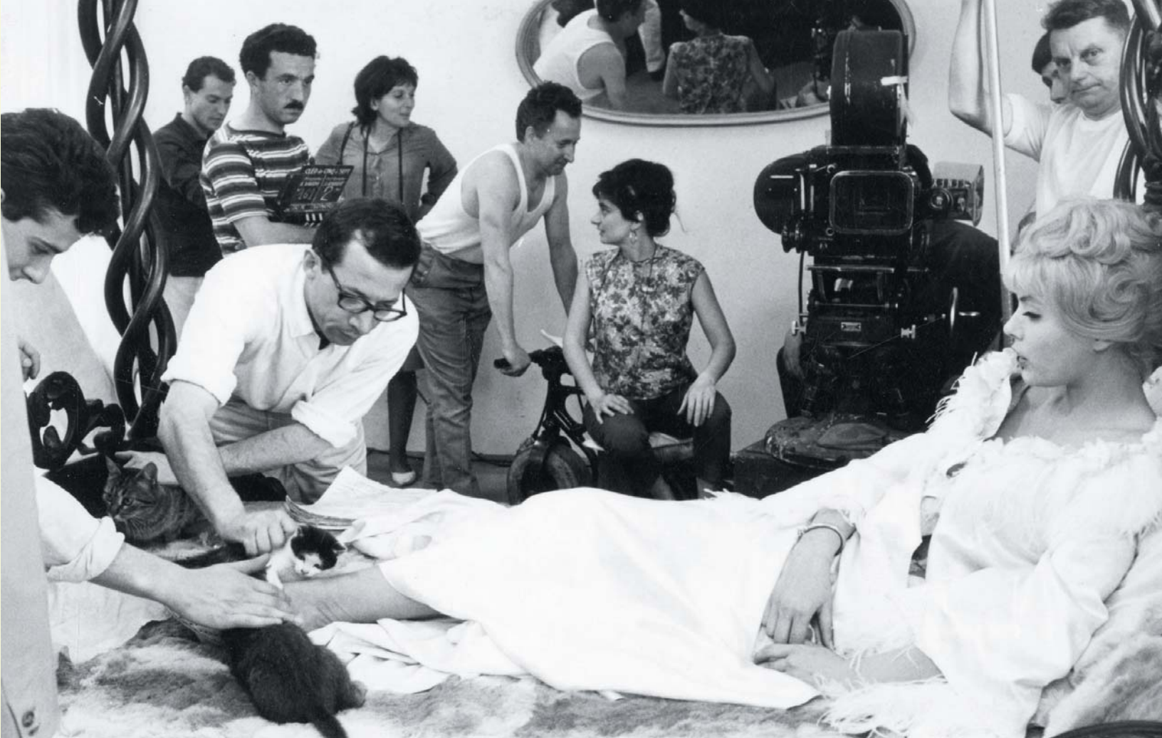
Agnès Varda (assise au centre) lors du tournage

d'ouverture, en dehors des enclaves codifiées, offrant une perspective «documentarissante».