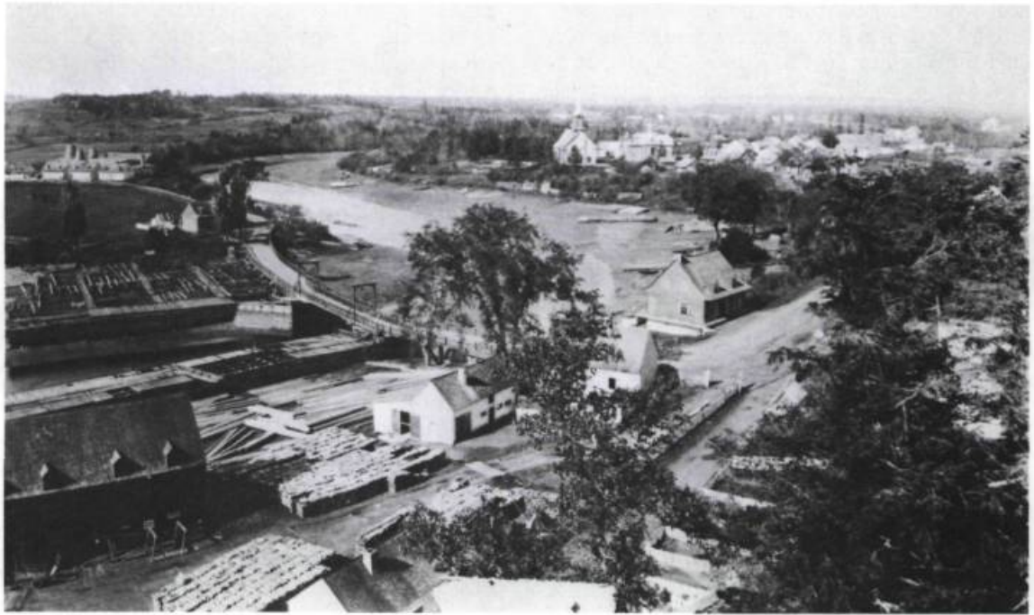
Vue du village de Saint-Félix-du-Cap-Rouge vers 1885-1890 avant la construction du viaduc ferroviaire.

possédait plus de 20 000 spécimens capturés surtout autour de Québec mais également lors de ses voyages aux États-Unis, aux Antilles, en Europe et en Palestine. En dépit du manque de ressources matérielles (argent, laboratoires, bibliothèques scientifiques) et de son isolement relatif par rapport aux chercheurs nord-américains, Provancher revendique l'identification de 923 espèces dans le seul ordre des hyménoptères. Plus de la moitié de ces travaux sont encore valides aujourd'hui.