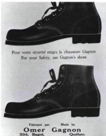
Une publicité d'Omer Gagnon.