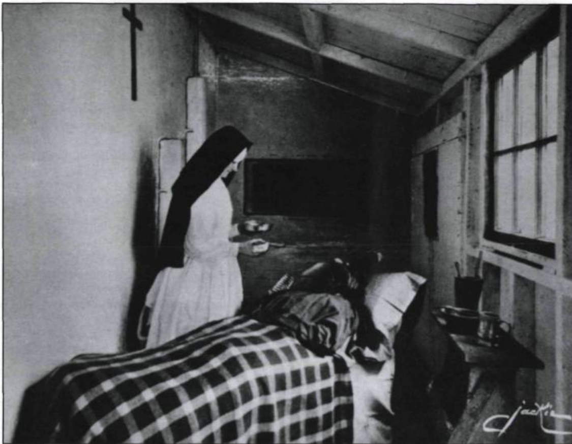
Les hospitalières consacrent une grande part de leur énergie à soigner les Amérindiens. (Photo: Jackie, carte postale, Collection Yves Beaugard).