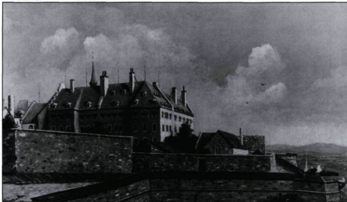
L'Hôtel-Dieu vu de la rue des Remparts en 1886, d'après H. Bunnett.

L'espace disponible permet d'accueillir 50 lits; cependant, à cause des compressions budgétaires, l'hôpital compte à peine 20 places. Jus-