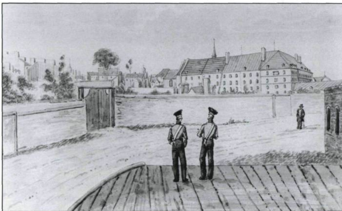
L'Hôtel-Dieu de Québec vers 1832, d'après une aquarelle de James Pattison Cockburn. (Ville de Québec, Division du Vieux-Québec).

Dès l'automne 1755, les travaux de reconstruction débutent. Au milieu de l'année 1757, les hospitalières emménagent dans leur nouveau monastère. L'entrepreneur, Jacques Deguise dit Flamand, respecte le plan initial de François de Lajoüe. Des escaliers, œuvres de Joseph Anger, témoignent encore de cette époque.