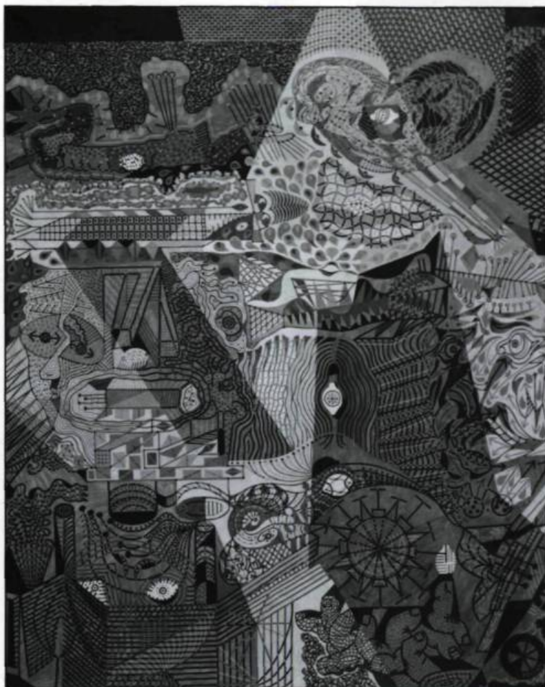
dont il illustre les recueils de poèmes, Les Îles de la nuit et Le Voyage d'Arlequin , en 1944 et en 1946 respectivement.

De plus en plus, par la suite, Pellan évitera les affrontements et préférera consacrer toutes ses énergies à la création. Il produit abondamment en suivant les mouvements de son instinct et de ses profondes convictions artistiques. La tendance surréaliste qui s'était dessinée dans son oeuvre au contact des trouvailles et idées des Breton, Picasso, Miro, Klee, Tanguy sur la scène parisienne, se développe à l'occasion de ses amitiés pour Alain Grandbois et Éloi de Grandmont