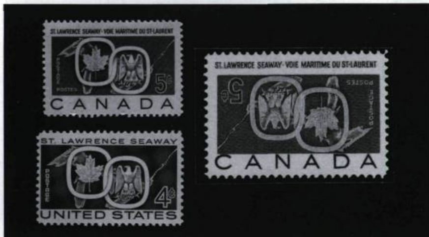
Le 26 juin 1959, le ministère canadien des Postes et le Service américain des Postes émettent conjointement un timbre pour souligner l'ouverture de la voie maritime du Saint-Laurent.

Par exemple, la rumeur publique a toujours accusé la France de négligence philatélique devant le grand nombre d'erreurs sur les timbres de 1902 et 1903 de la Côte française des Somalis. L'impressionnante série de 14 timbres illustrant des chameaux, des guerriers et des mosquées existe dans