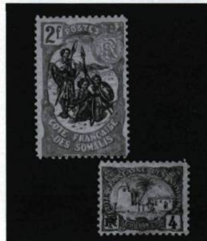
Cette série de vignettes postales de la Côte française des Somalis en 1902-1903 présente plusieurs erreurs.

nombreuses étapes du processus, un ouvrier imprime à l'envers sur un cadre à l'endroit (centre inversé) ou vice versa.