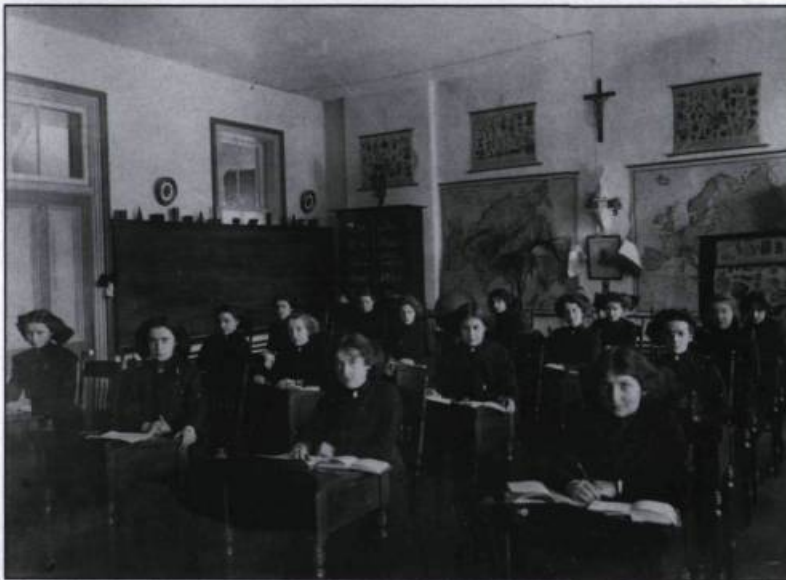
La classe de géographie en 1912. (Archives du collège de Notre-Dame-de-Bellevue).

maison de pierre, granges, étables, remises, bâtiments de ferme, serre chaude, orangerie, jardins».