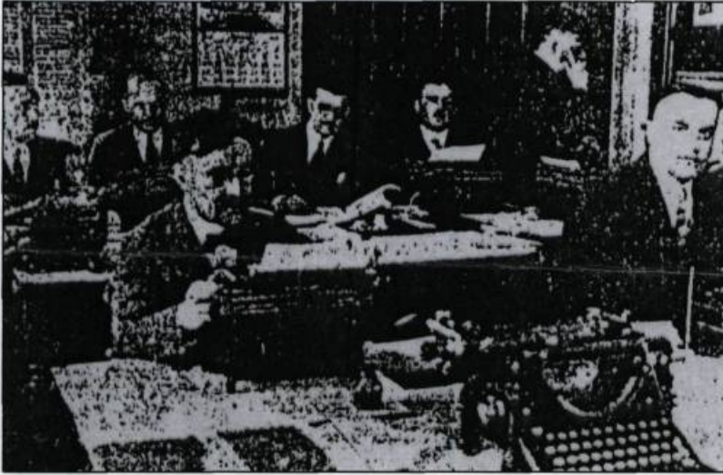
«La quatrième puissance au travail». Cette photographie a été prise dans la salle de presse aménagée, à l'époque, dans la tour centrale de l'Hôtel du Parlement. (Le Soleil, 25 février 1926, p. 1).

musique, la sculpture ou l'écriture. Nazaire Levasseur, chroniqueur parlementaire de l'Événement pendant neuf ans, est un musicien réputé. Organiste à l'église Saint-Roch entre 1873 et 1882, il avait participé à la fondation du Septuor Haydn en 1871. En Europe, des écrivains célèbres ont été chroniqueurs parlementaires: Charles Dickens à la Chambre des communes de Londres et Émile Zola à l'Assemblée nationale française. À l'Assemblée législative du Québec, Arthur Buies, Arsène Bessette, auteur du roman Le Débutant , Rémi Tremblay, qui a publié plusieurs poèmes et récits de voyage, font un séjour à la Tribune.