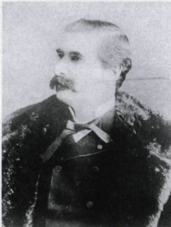
Honoré Mercier (1840-1894). À la tête de son parti national, Mercier remporte par une faible marge les élections d'octobre 1886 et devient premier ministre le 20 janvier 1887.

pourquoi elle souda pendant plusieurs années les énergies populaires au Québec.