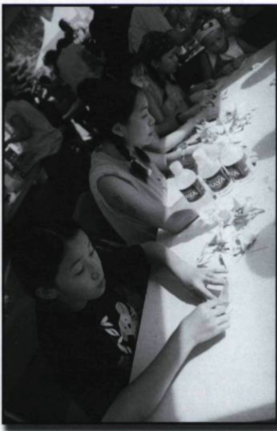
Origami : Fête des enfants de Montréal.

Si on dénote d'une part une volonté de s'affirmer chez la majorité des nouveaux Québécois, on constate d'autre part la volonté des Québécois d'origine de connaître et de comprendre leurs concitoyens d'origine étrangère. Cette démarche d'approvisionnement a donné naissance à de nombreux événements rassembleurs parmi lesquels Musique Multi-Montréal, le Festival interculturel du conte,