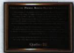
Plaque de la collection Pierre-Joseph-Olivier-Chauveau, conservée à la bibliothèque de l'Assemblée nationale. Photographie de Sylvain Lizotte, 2006. Répertoire du patrimoine culturel du Québec . (Ministère de la Culture, des Communications et de la Condition féminine).

Jean-François Drapeau Direction du patrimoine et de la muséologie, Ministère de la Culture, des Communications et de la Condition féminine