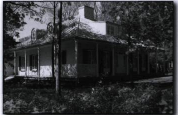
Maison Henry-Stuart, classée monument historique. Photographie de Marie-Claude Côté, 2003. Répertoire du patrimoine culturel du Québec . (Ministère de la Culture, des Communications et de la Condition féminine).

Le Répertoire du patrimoine culturel du Québec est l'interface grand public, disponible sur Internet, du système de gestion et de diffusion du