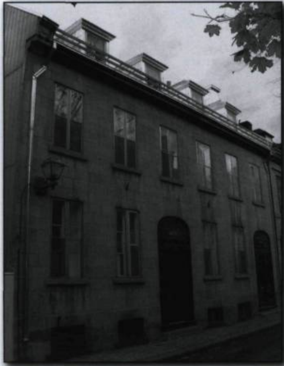
Maison du Vieux-Québec habitée par Joseph-Alfred Mousseau. Photographie de Pascale Llobat, 2006. Répertoire du patrimoine culturel du Québec . (Ministère de la Culture, des Communications et de la Condition féminine).

immeubles. Des travaux sont en cours pour documenter les quelque 55 000 biens mobiliers protégés par le gouvernement du Québec.