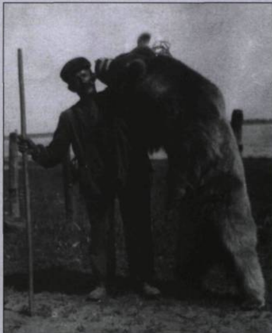
■ Montreur d'ours dans le secteur Pointe-du-Lac à Trois-Rivières, 1914.