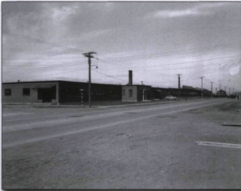
■ Mason Spinning Mills, 1945. (Archives Le Nouvelliste , N4206).

■ succès de cette usine soulignait, dès 1917, la nécessité d'attirer à Trois-Rivières une manufacture de soie. Elle produisait des vêtements de travail, des chemises de toilette et des pyjamas, en partie pour l'exportation. Elle a également produit des chemises pour l'armée canadienne lors de la Deuxième Guerre mondiale. L'usine fut vendue à la Style Guild, qui fabriquait aussi des chemises.