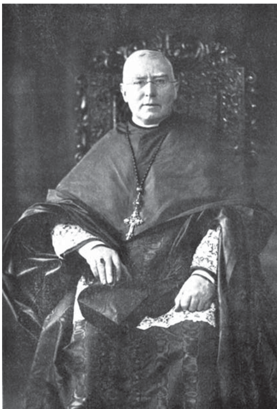
Francis Bourne (1861-1935), archevêque de Westminster, Angleterre.

Majoritaire durant tout le deuxième tiers du XIX e siècle, l'importante communauté anglophone de la ville représente toujours plus du tiers de ses habitants au début du siècle suivant. Cette minorité est largement surreprésentée au sein de la grande bourgeoisie capitaliste.