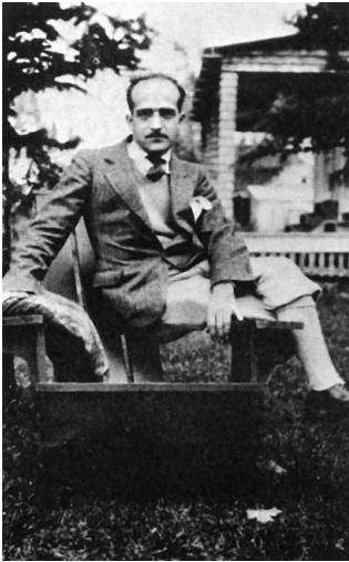
Paul-Émile Borduas vers 1945.

correspondance antérieurs à 1949 les moments de cette réflexion sur le temps qui culmine dans le Refus global mais qui déborde la peinture : « Les problèmes plastiques ne se posent plus en tant qu'art, mais en tant que conduite à suivre dans la vie [...] » 2 . Cette affirmation de 1947 rend bien compte du Refus global à propos duquel on s'interroge souvent sur son rapport entre l'esthétique et le manifeste social et où la dimension esthétique occupe finalement une place marginale. C'est que la démarche esthétique a transformé l'homme et son rapport au temps vécu et perçu, comme elle aurait transformé quiconque : « Mais je suis convaincu qu'où je peux me reconnaître dans ce qui m'est le plus intime, le plus particulier, des millions d'êtres pourraient aussi se reconnaître s'ils étaient passés exactement par où je suis passé » 3 .