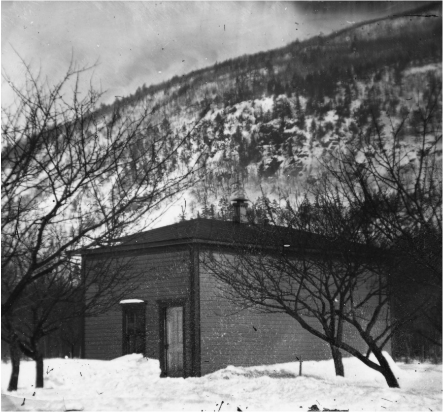
Fig. 1. Photographe non identifié, L'atelier d'Ozias Leduc au pied du mont Saint-Hilaire dans le verger familial en hiver , non daté, après 1890. BANQ Vieux-Montréal, MSS 327, S2_12.11.

selon ses moyens financiers est érigée en 1936, mais la finition intérieure et extérieure n'est pas complétée au moment de la vente de Correlieu à son frère Ulric Leduc en 1938. Marie-Louise Lebrun-Leduc décède en 1939 sans avoir vécu dans la maison qu'elle désirait. La maison comprend un atelier à l'étage supérieur que le peintre n'a utilisé qu'en de rares occasions dans les années 1930 et 1940. On le voit dans le film d'Albert Tessier, Quatre artistes canadiens (1939), à partir de la minute 5: 20. À la minute 7: 22 l'on aperçoit à contre-jour Rodolphe Duguay et Albert Tessier devant la grande fenêtre de ce deuxième atelier. En ligne sur le site de BANQ numérique, consulté le 2 septembre 2019, http://numerique.banq.qc.ca/patrimoine/details/52327/2282603 .