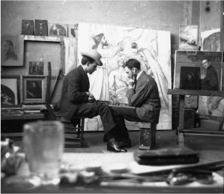
Fig. 2. Photographe non identifié, Ozias Leduc jouant aux dames avec un frère ou un ami à l'intérieur de Correlieu, 1899, BAnQ Vieux-Montréal, MSS 327, S13_1.2.