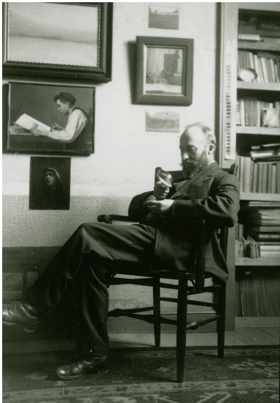
Fig. 5. Photographe non identifié, Oziás Leduc dans son atelier examinant un minéral , non daté, vers 1915. BAnQ Vieux-Montréal, MSS 327, S13_1.16