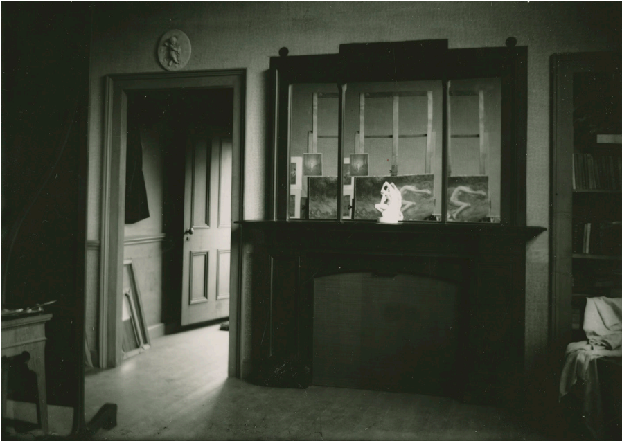
Fig. 4. Photographe non identifié, Intérieur de l'atelier d'Ozias Leduc , non daté, vers 1906, BANQ Vieux-Montréal, MSS 327, S12_13.20.

indéterminée puis, par la suite, avec du contreplaqué 16 . Un tapis de style persan garnit le plancher de bois. Une grande table, qui est un plan de travail pour le dessin et la correspondance, un chevalet, un tabouret et quelques chaises complètent ce modeste environnement décoré des dessins et tableaux de l'artiste. La table est parsemée de livres, de périodiques et de papier, toujours à portée de la main pour dessiner 17 . Le journaliste Jean Chauvin qui visite Leduc en 1928 décrit ainsi cet espace de travail :