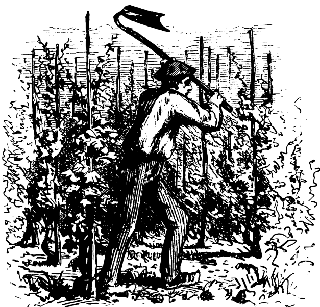
Vigneron du Fronsadais