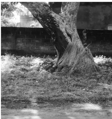
Figure 3 Arbre ( Daniela oliveri ) sacrificiel, dans le secteur 3