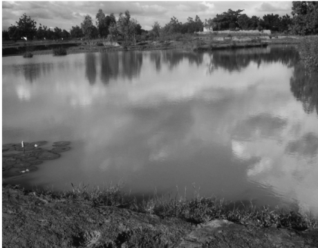
Figure 7 Marigot Rita samba, dans le secteur 5 de Koudougou

En ce qui concerne le marigot Rita samba, il est la propriété culturelle des autochtones de Sogpelcé. Ce marigot aurait la particularité de noyer toute personne ayant commis une aberration ou qui est animée d'un esprit maléfique (sorcier, tueur, etc.) et qui y entrerait ou s'en approcherait de trop près.