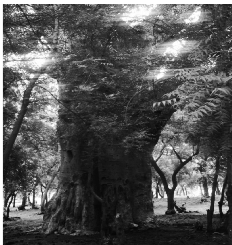
Figure 5 Baobab ( Adansonia digitata ) sacré du quartier Bourkina, dans le secteur 9

Adapté par le Département de géographie de l'Université Laval