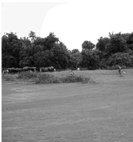
Figure 6 Forêt sacrée « Koongo »