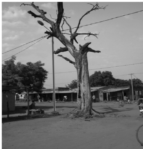
Figure 2 Kaya sénégalensis sacré, dans le secteur 3

Les arbres rares des savanes sont souvent considérés comme lieux de refuge des génies dont il serait dangereux de s'attirer les foudres (CIRAD, 2001). C'est ainsi que des espèces telles que kankanga ( Ficus gnaphalocarpa ), kankalga ( Daniela oliveri ), pusga ( Tamarindus indica ), siiga ( Anogeissus leiocarpa ) sont reconnues par l'ensemble des responsables coutumiers interrogés comme étant des espèces sacrées. La plupart de ces arbres abriteraient des esprits qui sont souvent vénérés. Chaque arbre possède ses génies, ses remèdes et ses sorts (Bonet, 1984, cité par Kaboré, 1994). Cela justifie les sacrifices offerts à ces végétaux qui, en retour, accordent aux donateurs, par l'entremise des entités surnaturelles qui les habitent, ce dont ils ont besoin, protection, santé et progéniture (figures 2 et 3). Ainsi, ce lien qui existe entre les hommes et les divinités apparaît comme un rapport de réciprocité, de don contre don ou de marché avec marchandage. Les interdits entourant certaines espèces végétales ont ainsi permis d'assurer la protection des îlots de forêt environnants. Pour Duchesne (2002), en raison des vertus qu'on leur prête, des lieux de refuge et de reproduction pour la faune et pour la flore sont préservés.