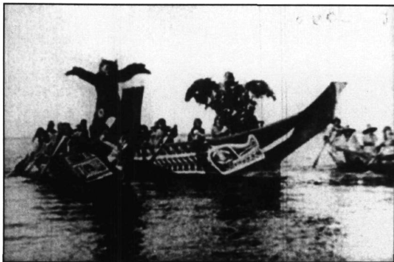
Land of the War Canoes La procession cérémonielle des canots avec des hommes déguisés en oiseaux.

Les formes utopiques du désir, découlant de la convergence du « primitivisme » et du divertissement populaire, peuvent être associées à la mémoire culturelle. L'allégorie de la représentation souligne l'essence de ce qui ne peut être représenté, ce qui existe en marge du cadre de la caméra de l'homme blanc. Curtis devait composer avec un environnement chaotique dans lequel l'exploitation des cultures différentes rivalisait avec l'émergence des formes d'un réalisme narratif. Dans Headhunters , ce réalisme a été confondu avec l'objectivité scientifique, ce qui a produit une forme de divertissement essentiellement perverse qui ne peut être associée à l'esthétique réflexive du modernisme. En tant que film expérimental, Headhunters peut cependant servir de modèle pour une forme de représentation ethnographique postcoloniale et postmoderne.