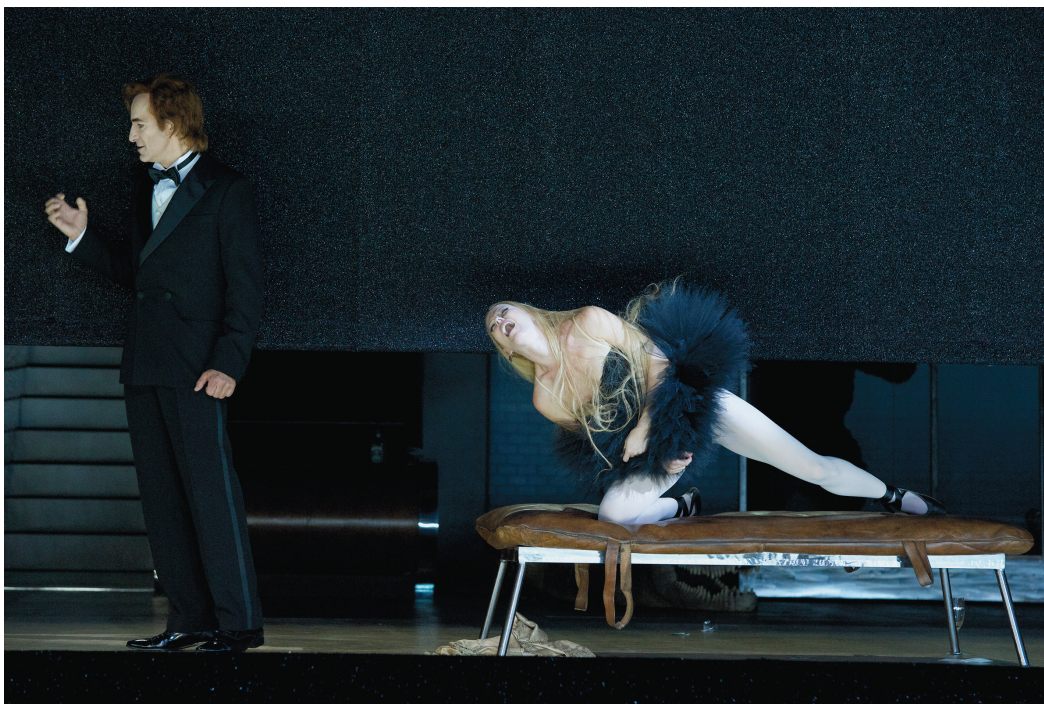
Barbara Hannigan (Lulu), dans une production de Lulu, d'Alban Berg (mise en scène de Krzysztof Warlikowski, La Monnaie, 2012). En bas, en compagnie de Dietrich Henschel (Dr Schön).