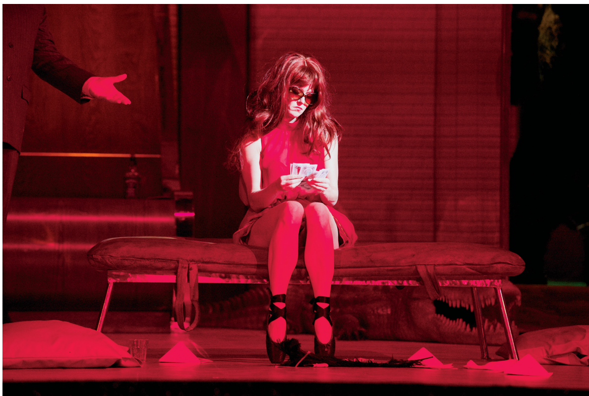
Barbara Hannigan (Lulu), dans une production de Lulu, d'Alban Berg (mise en scène de Krzysztof Warlikowski, La Monnaie, 2012).