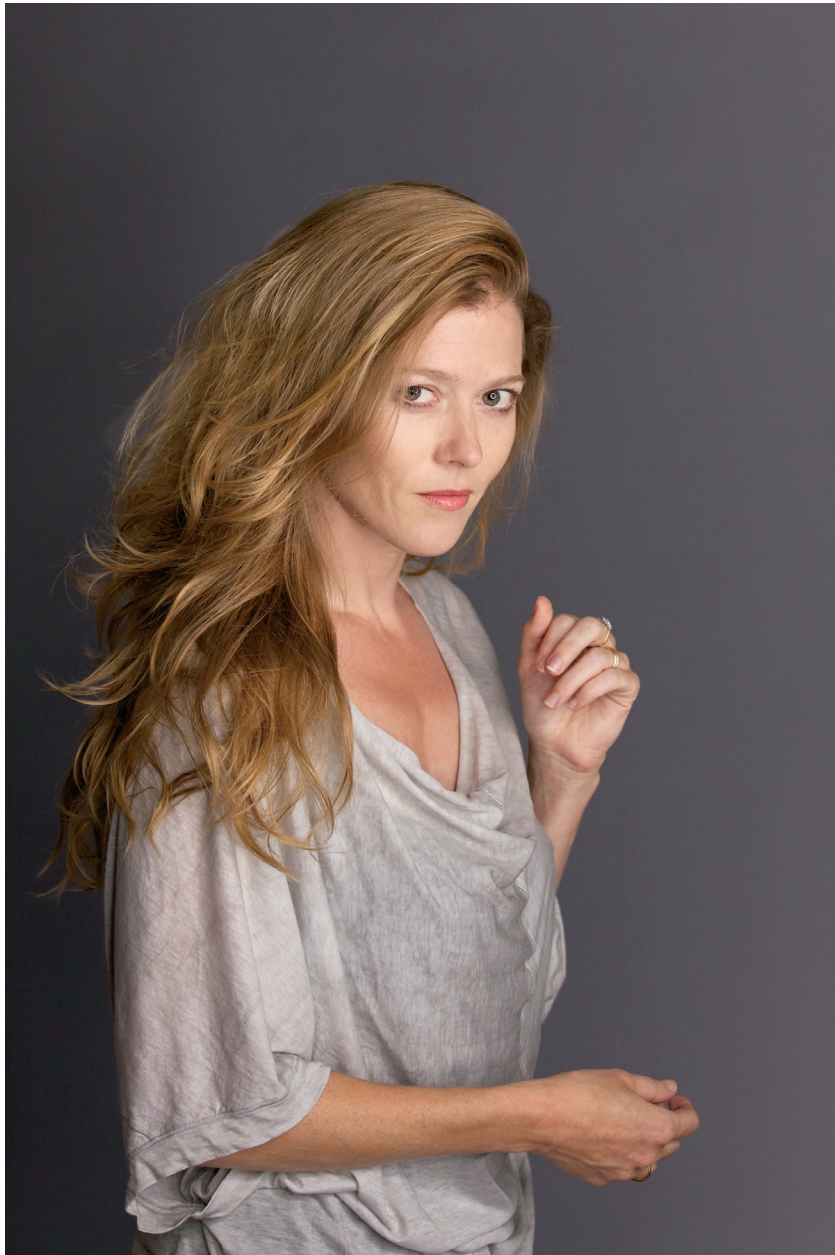
Barbara Hannigan.