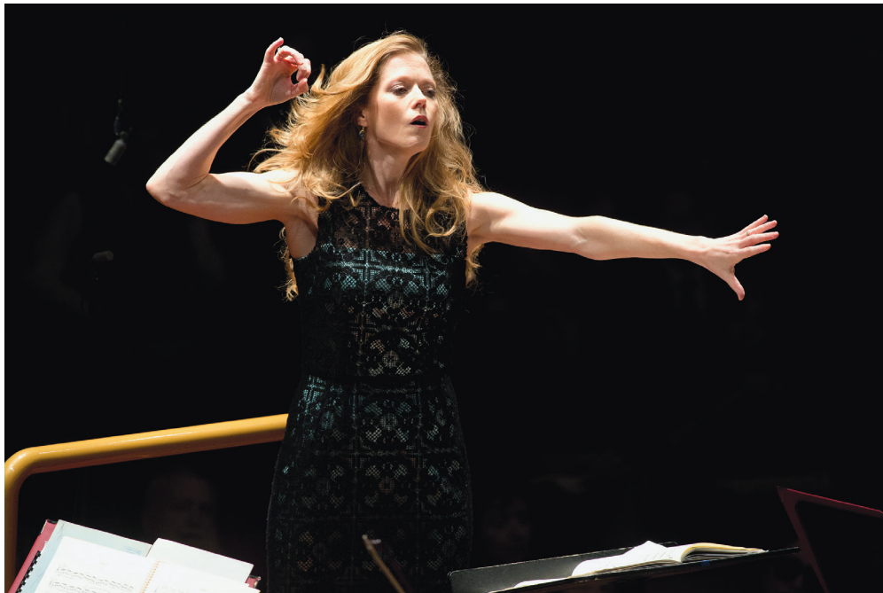
Barbara Hannigan.