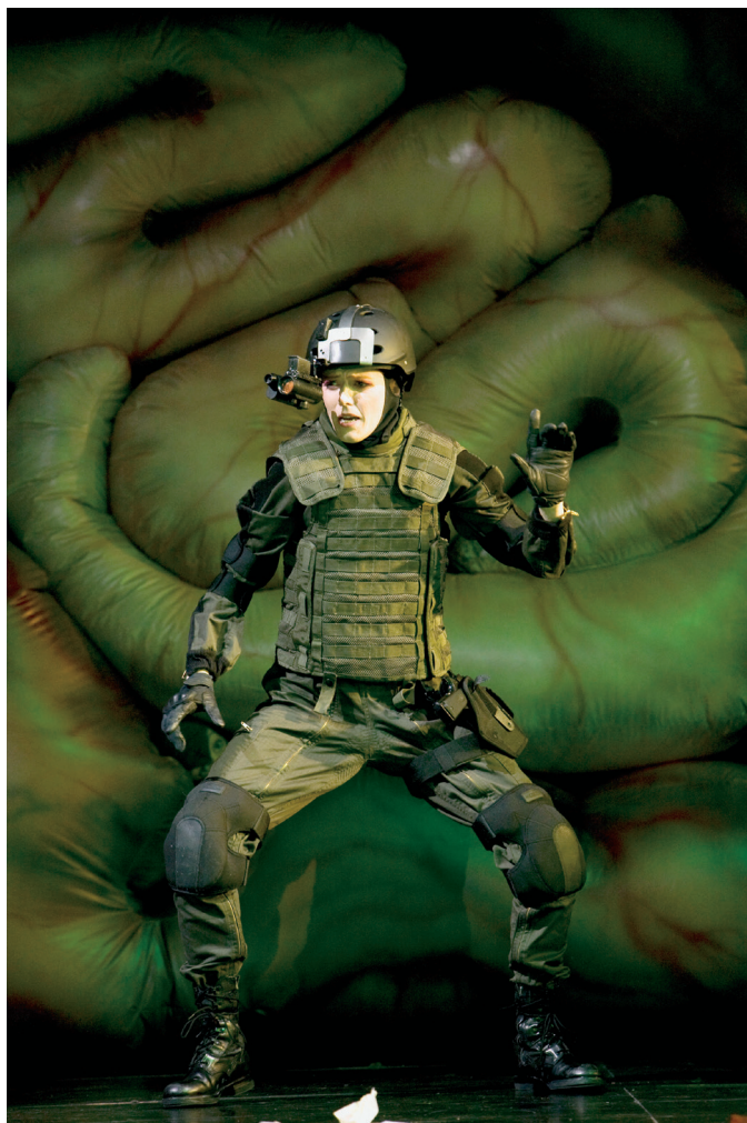
Barbara Hannigan (Gepopo, chief of the secret police), dans une production du Grand Macabre, de György Ligeti (mise en scène d'Alex Ollé, La Monnaie, 2009).

La Passione (2020), œuvres de Grisey, Haydn et Nono, LUDWIG Orchestra, Barbara Hannigan, direction, disque compact, Alpha Classics, Alpha 586.