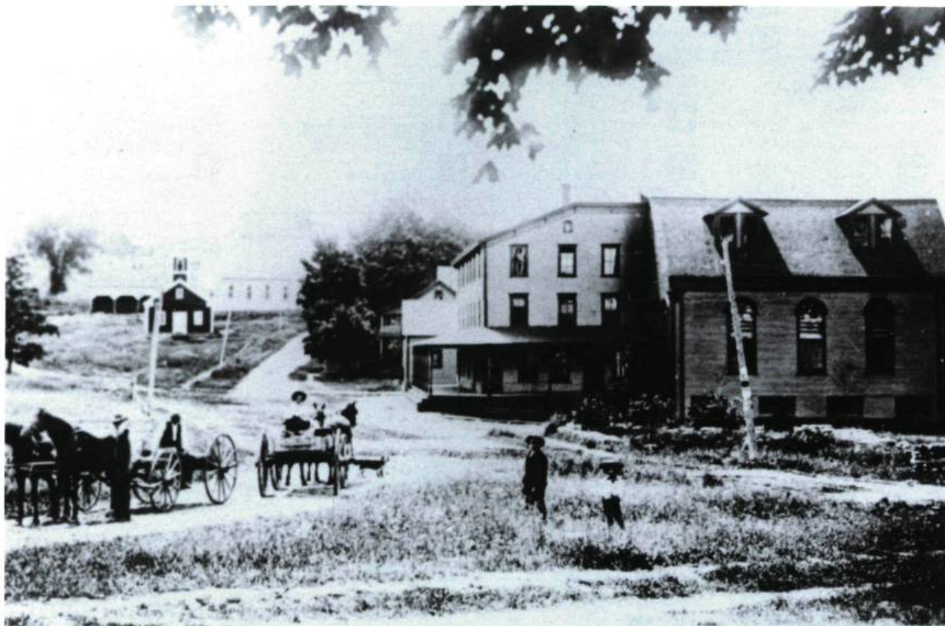
Hotel Elephantis - Georgeville P. Que