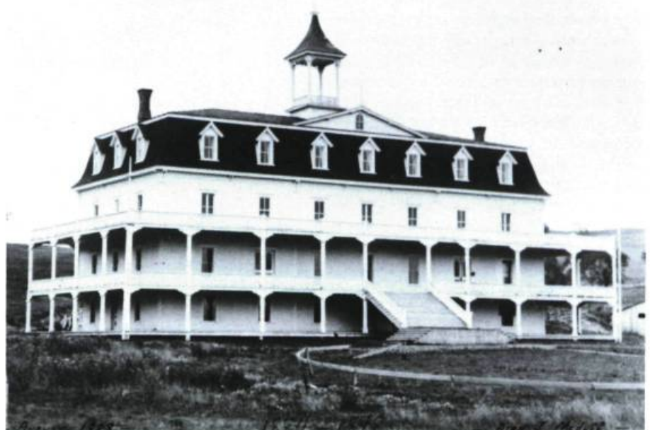
Hôtel New Camperdown.