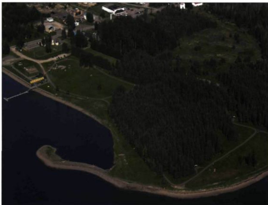
Vue aérienne du parc de la Pointe-Taylor, l'hôte des Jardins sur la baie.