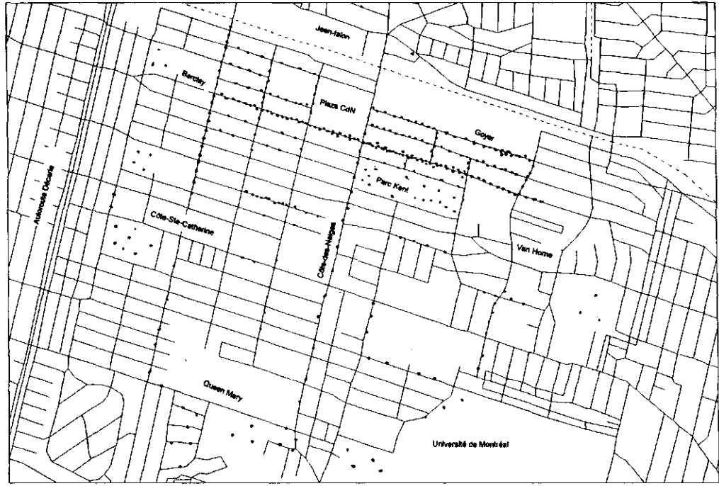
Figure 1 Distribution de la peur du crime dans un quartier de Montréal