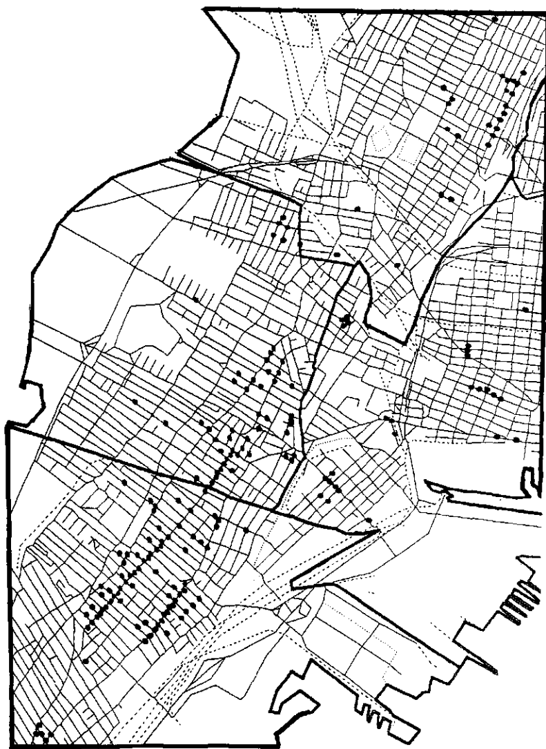
Schéma 1 Distribution spatiale des points de vente de drogues (n=226)