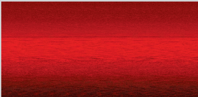
Failed , 2008, boîte lumineuse aux LEDs, 122 x 244 cm