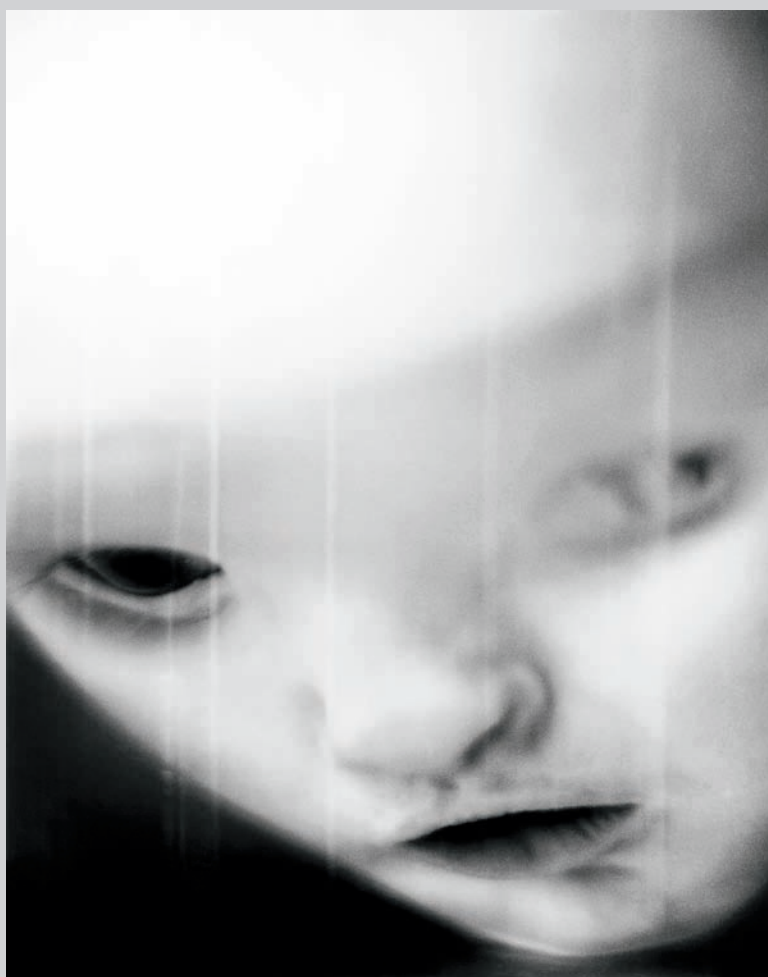
Lena Herzog , Untitled # 5 , Narrenturm, Vienna, Austria, 2007, gelatin silver print, 56 x 71 cm

The first room contains the work of Hong-An Truong. Her multi-perspective video montage Adaptation Fever (2006–07) is made up of found black-and-white film footage from Indochina. Images are fragmented, cut off, and sometimes mirrored against one another. Viewers quickly become aware of the flatness of photography as images fold into themselves like filmic origami. Footage is sped up, and we only briefly glimpse prosaic scenes such as a young child reaching up to grasp the cross hanging around a priest's neck. Other scenes include a boxing match, a burning car, a group of can-can dancers, and a