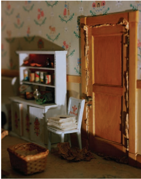
Three Room Dwelling (gun), 28 x 36 cm