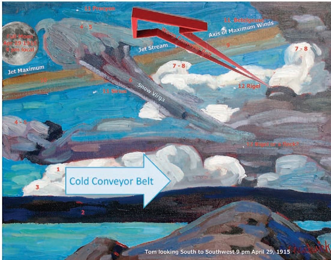
Clouds (The Zeppelins), 1915

grandes heures de l'art canadien revisitée à l'aune de la criminalistique météorologique se retrouvent enrichies d'une dimension vériste et gagnent alors un ADN climatique.