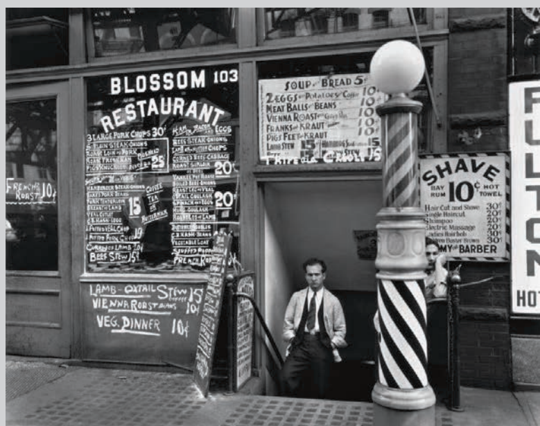
Blossom Restaurant, 1935