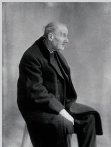
Atget profile, 1927, © Berenice Abbott / Commerce Graphics

The AGO exhibition includes a large selection from Abbott's Changing New York City project, which she began after returning to New York. This is snapshot anthropology at its best! The New York scrapbooks (1928–30), all on view in the vitrines in the AGO's darkened interior show space, were the fuel for Abbott's Changing New York City series. Shots of Chinatown and Manhattan are pure exploration of urban space, architecture, and the movement of people in the