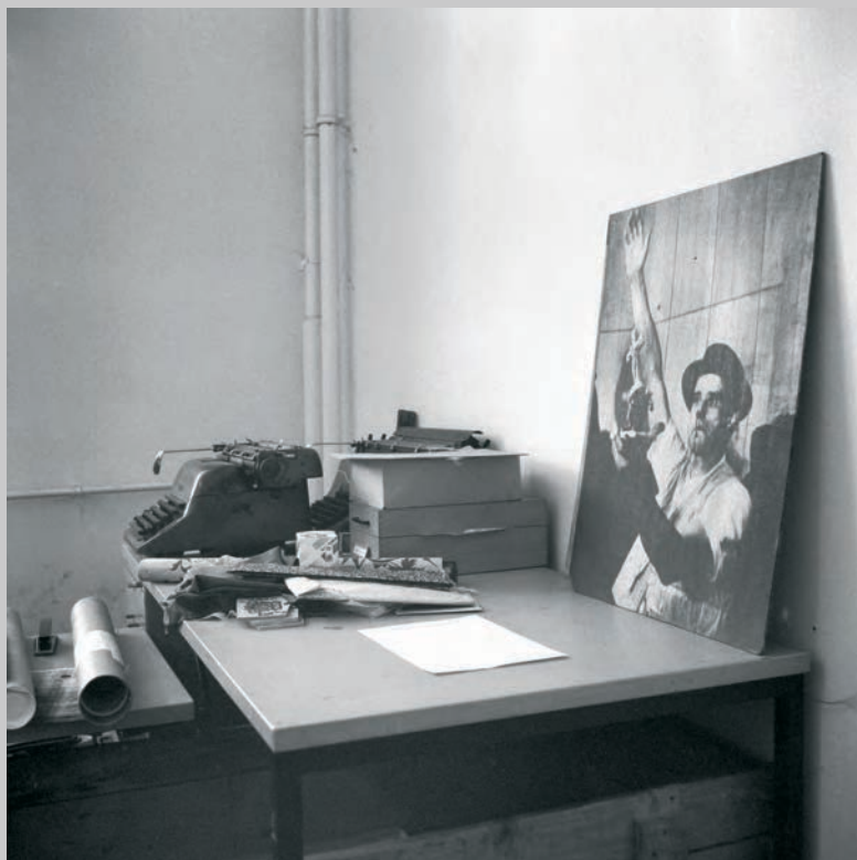
Table de travail avec grande photo de la performance «Fluxus» de 1964, 1984, impression jet d'encre, 51 x 51 cm