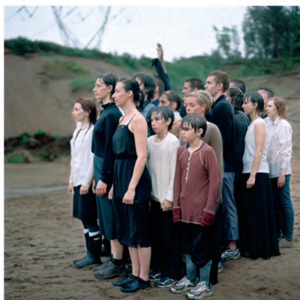
Rôdeur 3 et Souffle, de la série Parcours , 2012, impression jet d'encre, 89 x 109 et 99 x 102 cm