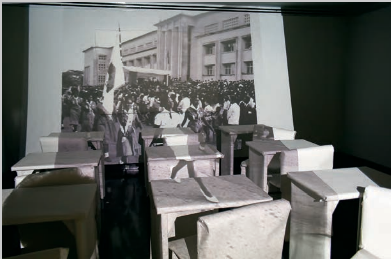
Michael Snow, from the series TAUT , 2012, courtesy of the Artist

Reading the Black Star Collection Ryerson Image Centre, Toronto 29 September to 16 December 2012