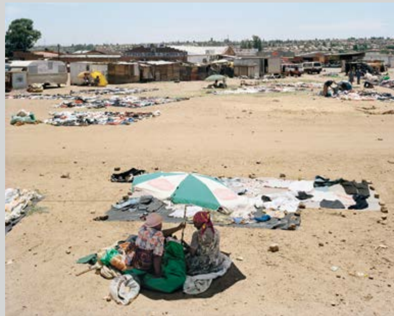
Here, on 26 June 1955, under harassment by the police, some 3000 people from all over South Africa, representing many organisations, adopted the Freedom Charter, which inspired the constitution of post-apartheid democratic South Africa. Freedom Square, Kliptown, Soweto, Johannesburg. 10 December 2003, from the series Structures of Dominion and Democracy , inkjet print, 140 x 173 cm, courtesy of the Marian Goodman Gallery

If Goldblatt sees these buildings and places as expressing the normalization of coercion and corruption as acceptable ways of life, his response is that of photography practised as a means of interruption and denaturalization. His is one of the world's great projects of documentary reportage and, as such, is clearly distinguishable from the interventions of Edward Burzynsky, Alfredo Jaar, and Sebastiao Salgado, whose practices rest on pictorial