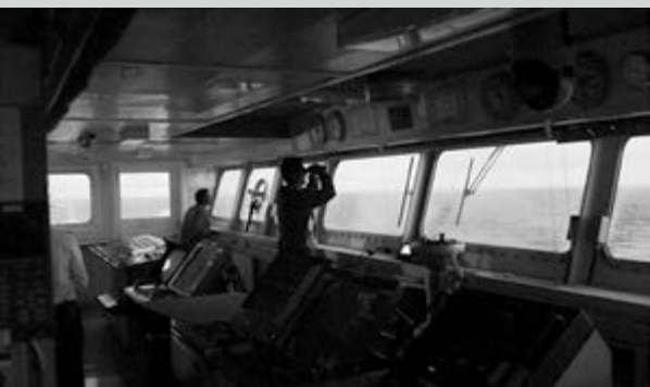
Photogrammes du film Transatlantique , 2014, Montréal, 72 min