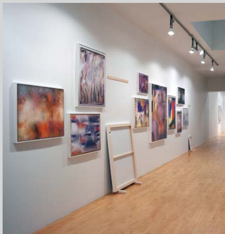
Dépeindre, 2014, vue de l'exposition