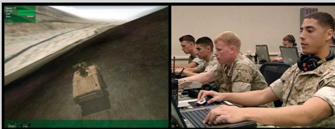
Serious Games I, Watson is Down, 2010, still from video installation, courtesy of the Green Naftali Gallery, NY

Morel creates a dramatic spatial framework within which Farocki's work immerses the viewer in an alternate multi-perspective reality. The exhibition begins in a bright, narrow hallway and continues through a second hallway in complete darkness, with black walls and floors, which leads to a dimly lit square room. Entering carefully, we position ourselves in the centre of a kind