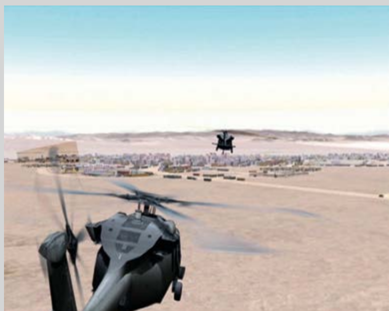
Serious Games 2, Three Dead , 2010, still from video installation, courtesy of the Green Naftali Gallery, NY