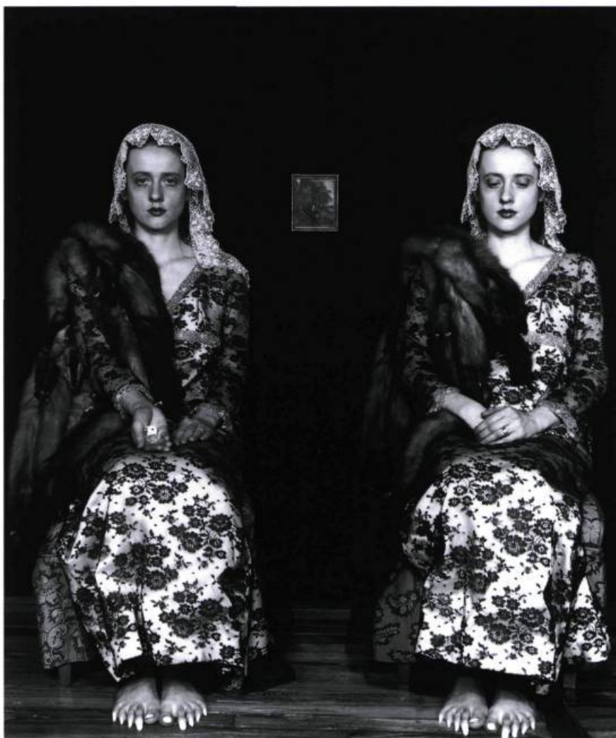
Twin Manicurists Épreuve argentique, 35.5 x 28 cm. 1996