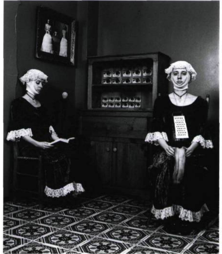
Confession Épreuve argentique, 35.5 x 28 cm, 1995