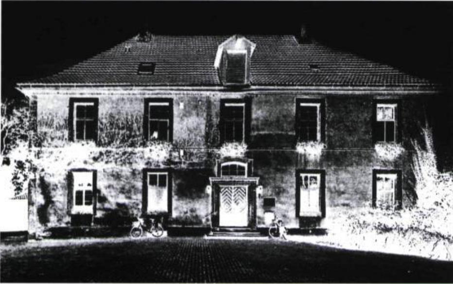
extraits de Fractured Legacy Installation, 1997