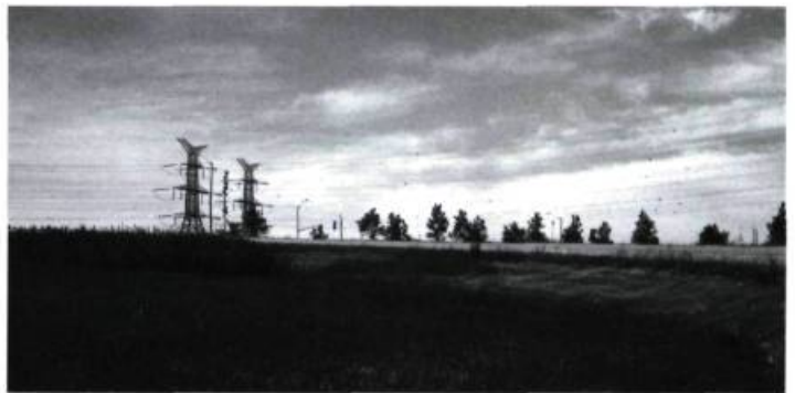
Paysage étalonné, bretelle d'autoroute, près de Toronto, Ontario, 1997, 110 X 165 cm, épreuve couleur.