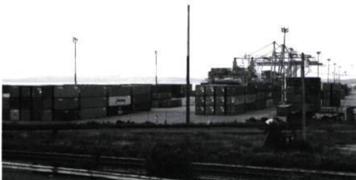
Paysage étalonné, containers dans le port d'Halifax, Nouvelle Écosse, 1997, 110 X 165 cm, épreuve couleur.