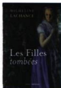
LES FILLES TOMBÉES Québec Amérique, 2008