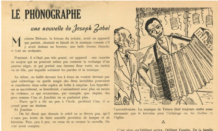
Figure 3 (mai 1964).

Dans le cas du « Cadeau », de manière moins frappante, l'illustration donne à voir le moment où l'horloger, M. Atis, donne la montre au jeune narrateur : les liens entre les personnages sont alors plus importants que les indices fantastiques qui inaugurent et cloisent le récit, et l'aspect réaliste, la relation entre l'enfant et l'artisan, prend le pas sur la sorcellerie qu'annoncent les premières lignes du texte (voir figure 4).