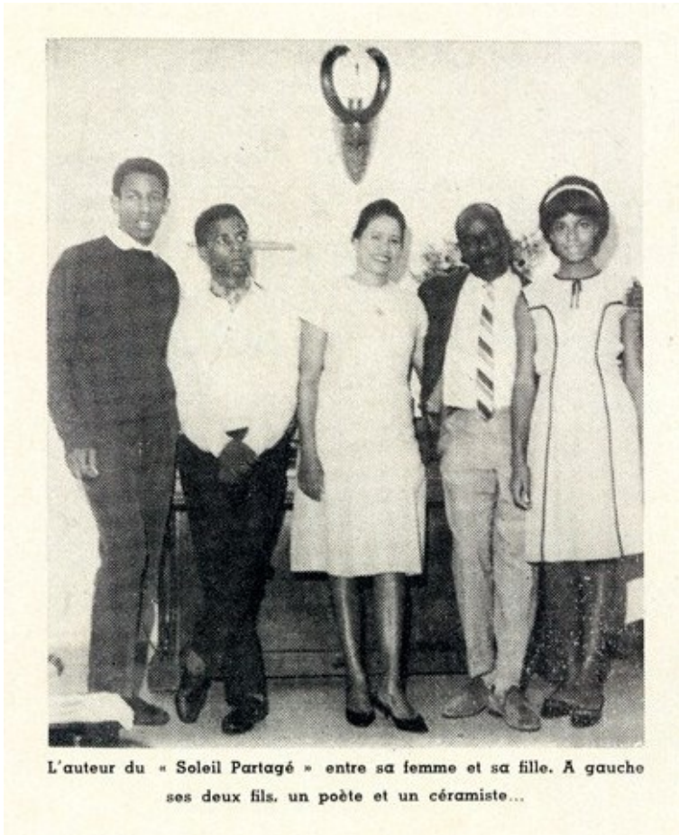
Figure 2 – Source : https://www.awamagazine.org (janvier 1966).

Cette mise en scène est complétée dans l'article par une analyse des nouvelles de Soleil partagé , d'autant plus intéressante qu'il n'est pas fait mention de la parution de deux d'entre elles dans le périodique :