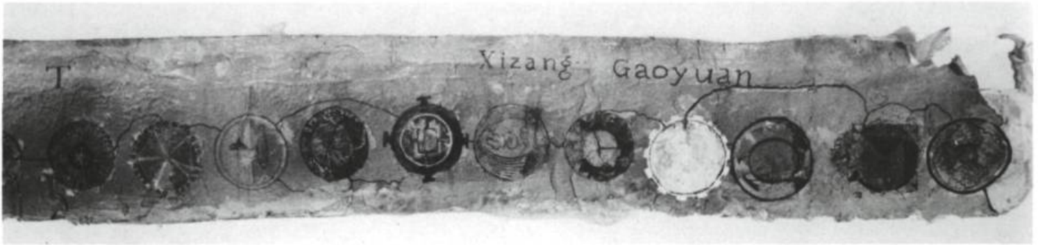
Richard Purdy, Progeria longevus . Détail.

La question se pose de savoir si le modèle réduit [...] n'offre pas, toujours et partout, le type même de l'oeuvre d'art.