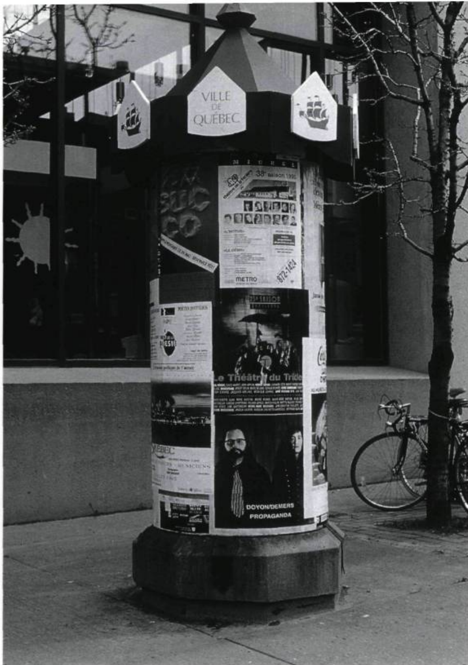
Doyon/Demers, Propaganda , 1995. Campagne d'affichage, Colonne Morris, du 2 mai au 6 juin/Poster campaign, Colonne Morris, from May 2 nd to June 6 th , Québec.

tégie de "mise en place". Pour Propaganda , cela nous permet de parler d'une sculpture d'outre-dimensions. Comme si les dimensions sociale et politique faisaient également partie des paramètres sculptés. Le pastiche d'une campagne publicitaire avec ses phrases lapidaires au bas des affiches, impose un sens premier à leurs actions. L'art est un loup pour l'art , Doyon/Demers Propaganda , Oeuvres et Oeuvres d'art au noir , Doyon/Demers Contournements et Détournements des fonctions connues de l'artiste , L'oeuvre d'art est dans ce que l'on fait de l'oeuvre , autant de phrases qui