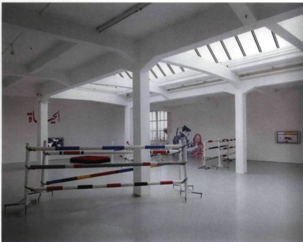
Mounir FATMI, Obstacles , 2003. Installation, technique mixte avec vidéo. Vue de l'installation au Migros Museum, Zurich, 2003.

En arrivant à la vieille aluminerie de Jean Chrétien, retour de cette Afrique, on trouvait un peu kitsch la flamme de Martin Honert qui accueillait le visiteur et on s'étonnait de ce qu'aucun artiste africain n'ait été convié à y donner sa vision des « éléments de la nature »... ←