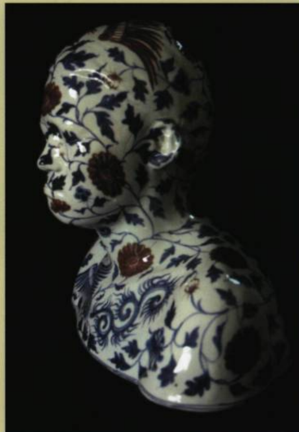
Ah XIAN, Buste en porcelaine chinoise 37, 1999. Porcelaine à décor de phénix et de lotus peints sous glaçure en rouge cuivre et bleu de cobalt. 38,1 x 33 x 22,9 cm. Collection de l'artiste. © Ah Xian.