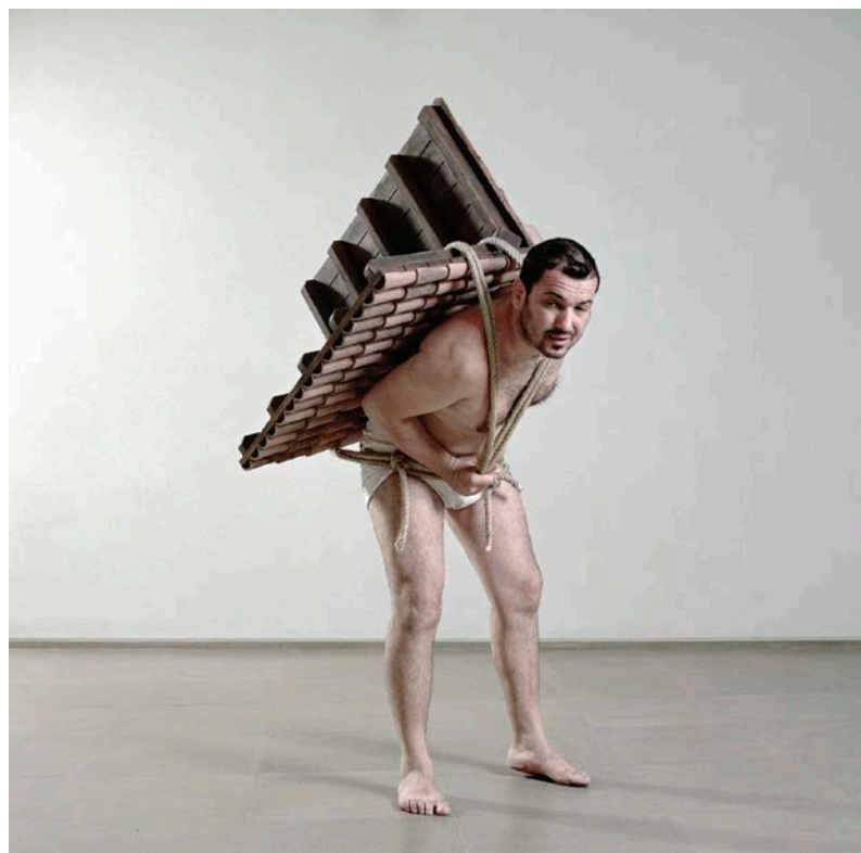
Adrian Paci, Home to Go , 2001. Colour photograph/Photographie couleur, 150 x 150 cm.

de justice sociale. L'ONG freeDimensional ( freedimensional.org ) se sert de résidences internationales d'artistes, entre autres, pour offrir un refuge aux artistes et aux travailleurs culturels vivant dans des zones à haut risque et qui sont menacés en raison de leur travail artistique ou de leurs opinions politiques.