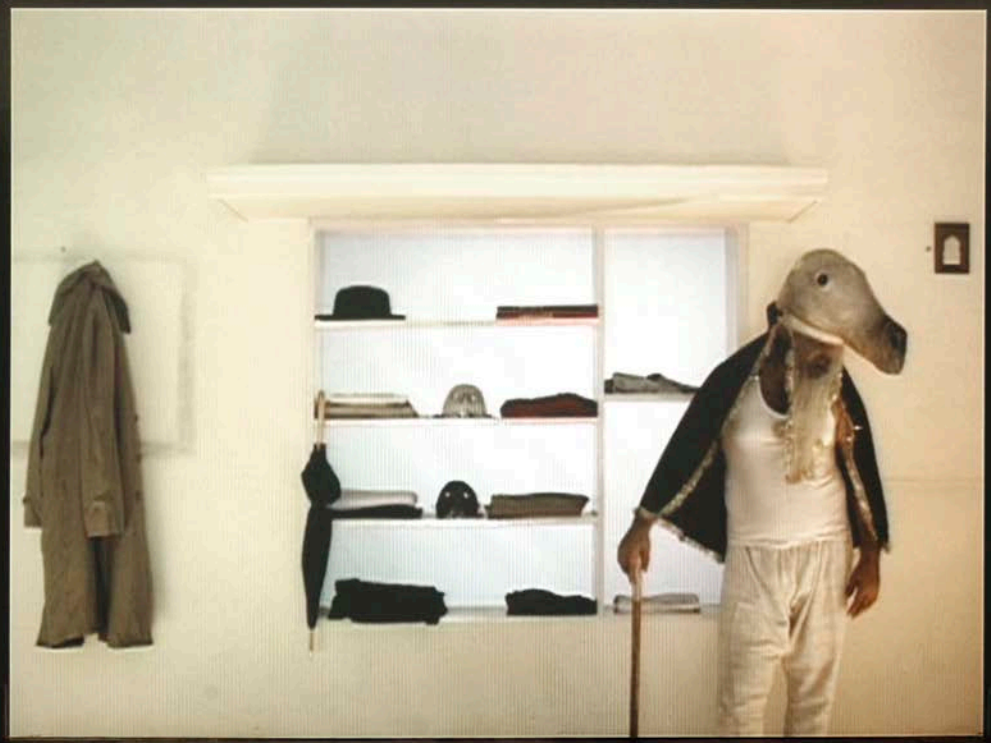
Raqs Media Collective, Impostor in the Waiting Room , 2004. Variable dimensions, video, text, printed images, chicken wire, wood/Dimensions variables, vidéo, texte, images imprimées, fil de poulailler, bois.

Dans sa vidéo Centro di Permanenza Temporanea (2007), l'artiste albanais Adrian Paci explore une autre dimension inhérente à la migration et au déplacement : la notion de voyage différé, d'attente indéfinie et de frontières intangibles. La brève vidéo montre une passerelle isolée sur laquelle on voit un groupe de gens désespérément abandonné pendant que, tout autour d'eux, des avions décollent et atterrissent. Paradoxalement et lumineusement, ce sont précisément l'imperceptibilité des migrants, leur non-reconnaissance et leur exclusion de l'appartenance territoriale que met en relief Paci en cadrant la visibilité flagrante et l'immobilité kafkaïenne du groupe (non documenté) contre la toile de fond des avions qui sillonnent le ciel avec leurs passagers invisibles (mais documentés), à qui l'on donne accès aux réseaux mondiaux de l'hypermobilité. Cette tension entre l'immobilité de l'attente perpétuelle et la mobilité du voyage mondial, entre visibilité et invisibilité, est approchée d'un point de vue plus historiquement infléchi dans l'installation vidéo The Impostor in the Waiting Room (2004) du groupe artistique Raqs Media Collective, établi à New Delhi.