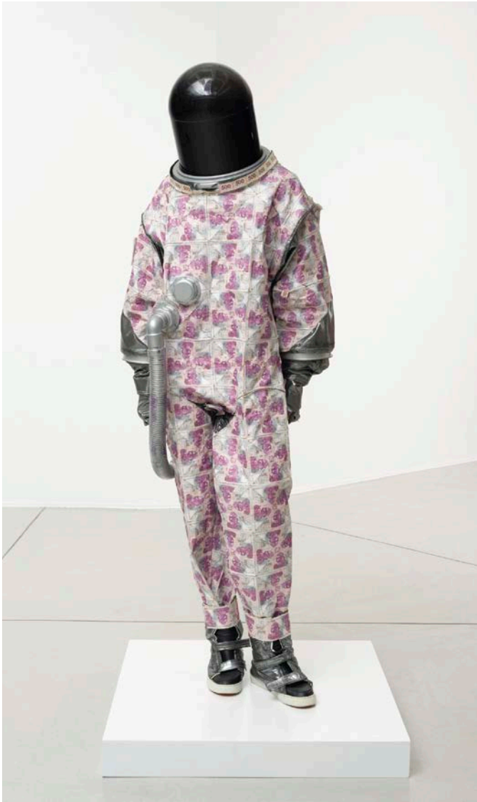
Gerald Machona , Ndiri Afronaut ( I am an Afronaut ), 2012. Decommissioned Zimbabwean Dollars, Foam Padding, Fabric, Wood, Perspex Rubber, Plastic Tubing, Nylon Thread and Gold Leaf/Dollars zimbabwéens retirés, rembourrage en mousse, tissu, bois, fil de nylon et feuille d'or. P. 19: Gerald Machona , People From Far Away , 2012. Stills from the video/Images tirées de la vidéo.