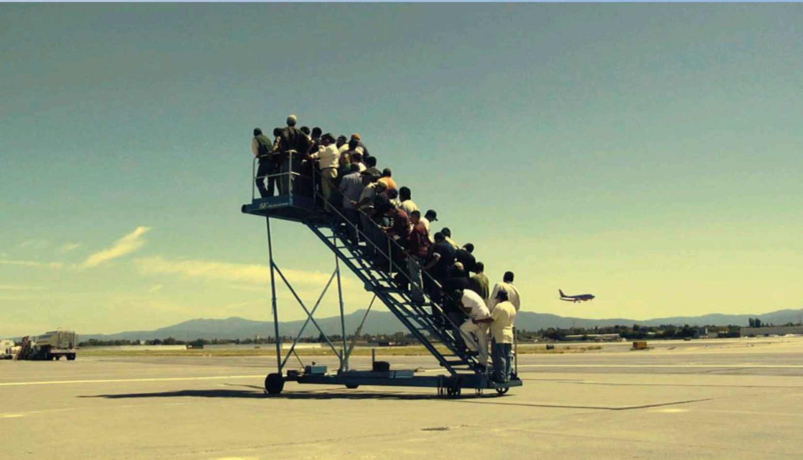
Adrian Paci , Centro di permanenza temporanea , 2007. Video/Vidéo, 4 mn 32 sec.