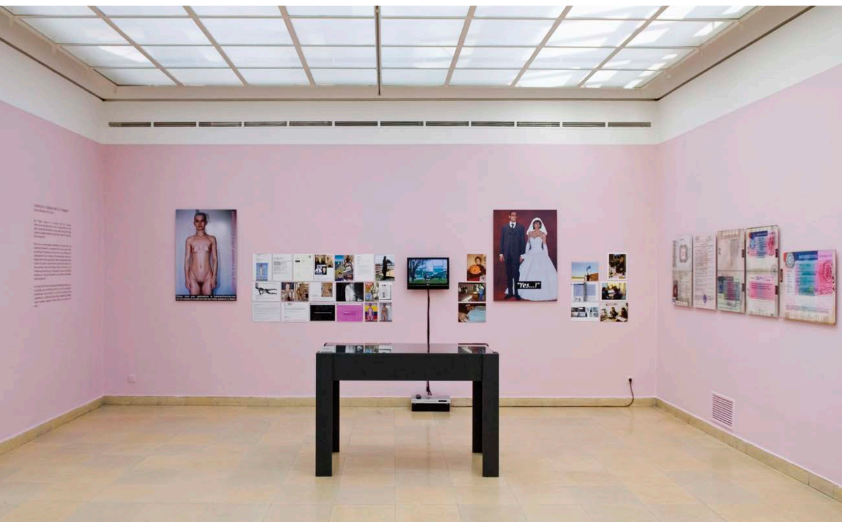
Tanja Ostojić, Looking for a Husband with EU Passport , 2000–2005. P. 14: The "ad" from the participatory web project, combined media installation/Tiré de la publicité du projet web participatif, installation de médias combinés. P. 15: Detail from the installation/Vue de l'installation.

raciste). De plus, les mouvements transnationaux de mondialisation sont également marqués par la mobilité de gens disposant des moyens et du statut requis pour voyager dans les circuits de l'économie mondiale. Il y a, d'une part, une mobilité protégée qui repose sur le privilège et sur une relative richesse et, d'autre part, la mobilité incertaine de gens en transit qui se heurtent constamment aux frontières, aux obstacles légaux et, trop souvent, à la misère, à l'exploitation, à la violence, voire à la mort. En ce sens, la migration toujours plus grande, le mouvement de gens touchés par le gouffre sans cesse creusé par le capitalisme financier sont l'expression des conditions dévastatrices que sous-tendent la mondialisation et son avancée 1 .