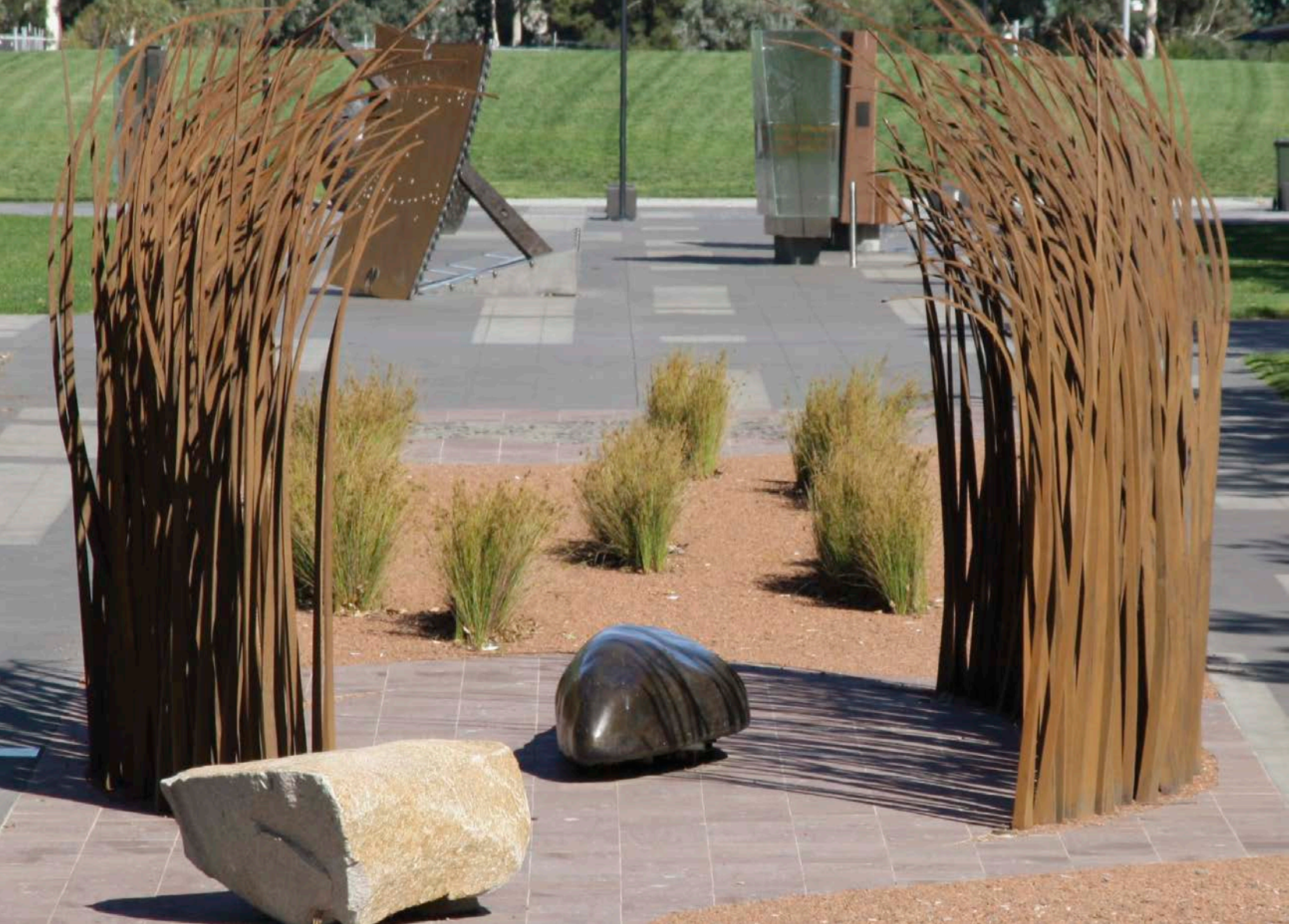
Commemorative precinct Reconciliation Place , Canberra (Kringas Architects, 2001), intersecting the main grassy land axis between Parliament and the Australian War Memorial / à l'intersection d'un terrain d'herbe situé entre le Parlement et le Australian War Memorial .

and abstract, eschewing didactic text and imagery. 7 But this project's brief also encouraged a site-specific dialogue within the landscape of the National Mall, framing a memorial to a lost, questionable war in an off-axis location with sightlines to earlier triumphant, unifying war memorials: the Washington Monument and Lincoln Memorial. These arrangements establish a spatial dialogue that contests and modifies the official histories told by those earlier works, suggesting perhaps that the American vision has lost its way. Groups dissatisfied with the memorial's negativity and abstraction forced the inclusion of a dialogic figurative rejoinder, The Three Servicemen (Frederick Hart, 1984), and sought to turn the wall into a mere backdrop.