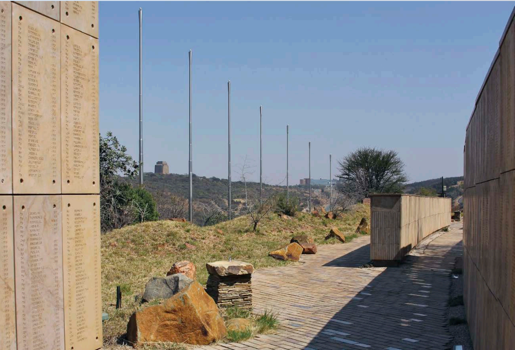
Wall of Names at Freedom Park, Pretoria (GAPP Architects/Urban Designers, MRA Architects and MMA Architects, 2007) and view to nearby/à proximité du Voortrekker Monument (background left/ arrière-plan, à gauche: Gerard Moerdijk, 1949).