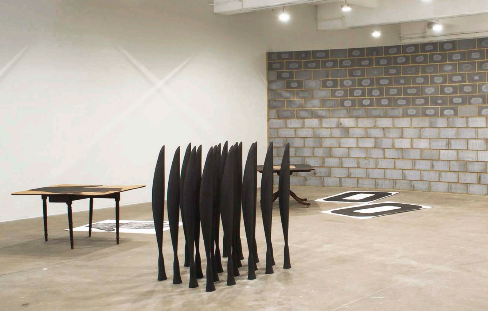
Lucy Skaer, The Siege , 2008. Vues de l'exposition, Chisenhale Gallery, Londres. Médias mixtes, dimensions variables. Avec l'aimable permission de l'artiste. Photos : Andy Keate.

Chisenhale Gallery, Londres, 2008. Le lieu d'exposition est cette fois partagé en deux par un grand mur en parpaings de béton, de façon à simuler conceptuellement un état de siège. Dans la zone extérieure de cette « place forte », qu'on rencontre en rentrant dans l'exposition, on retrouve les « assaillants » : deux dessins de grandes dimensions, une version déformée de La Grande Vague (environ 1830) d'Hokusai et une reproduction du Déluge (environ 1517) de Léonard de Vinci, l'un accroché au mur, l'autre étendu au sol. À l'intérieur des « remparts », des tables anciennes, transformées en plaques d'impression, sont présentées avec les images résultantes. Elles sont accompagnées par une structure en bois, dont la forme est empruntée à un détail du tableau Landscape from a Dream (1936-1938) de Paul Nash. Une vingtaine de reproductions de la sculpture Oiseaux dans l'espace (1923) de Brancusi, portant le titre de Black Alphabet et produites en poussière de charbon comprimé, sont tantôt rassemblées en ordre serré tel un escadron, tantôt posées à terre. L'exposition vibre de références à la guerre et au paysage naturel ou domestique. Un état de tension s'en dégage, et on imagine un bouleversement imminent – guerre, catastrophe naturelle ?