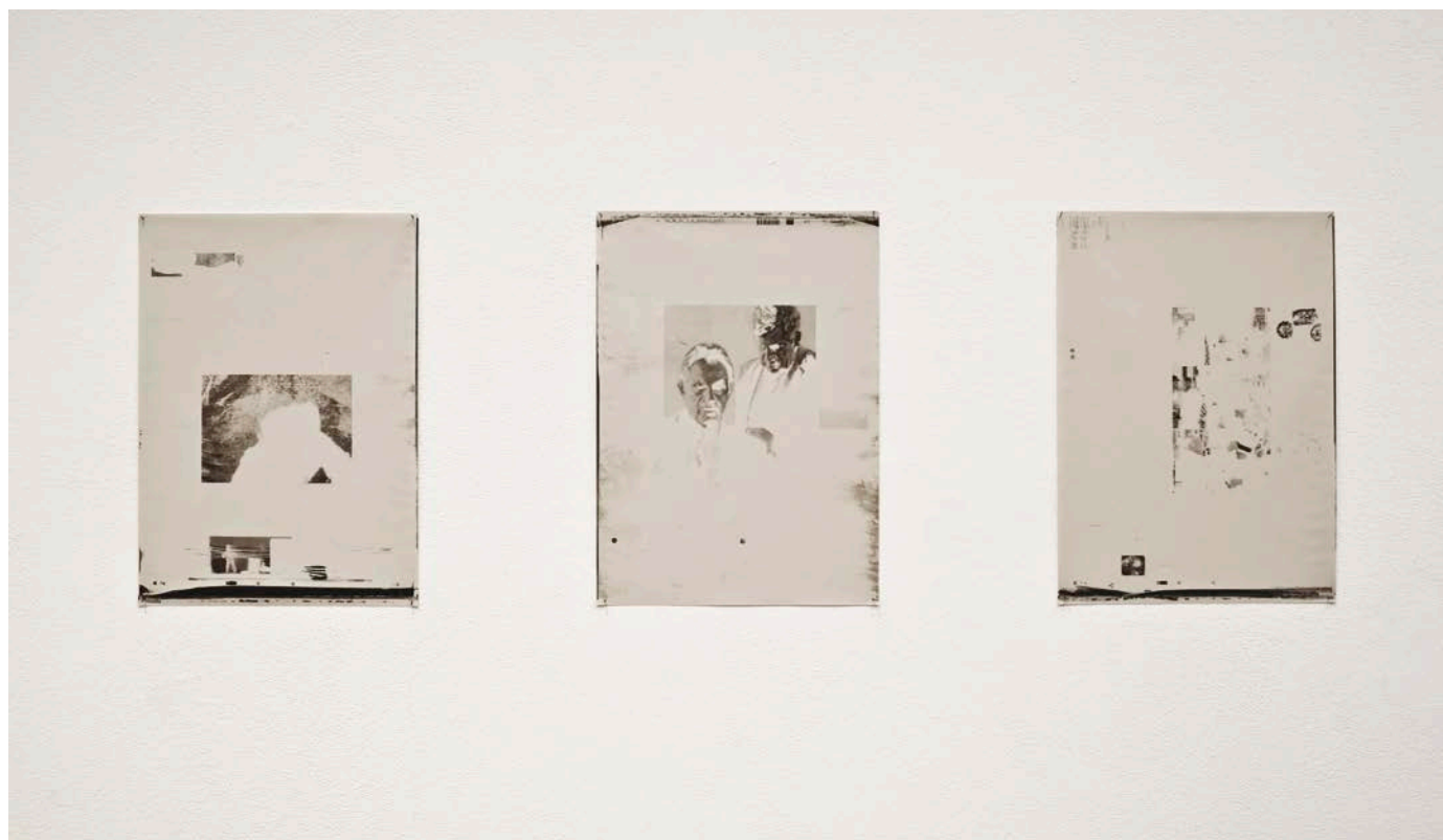
Lucy Skaer, 13.08.13. – 04.10.13. (détail), 2013. Estampes lithographiques à partir de plaques du quotidien The Guardian , 2013. Vue partielle de l'exposition au Tramway, Glasgow.