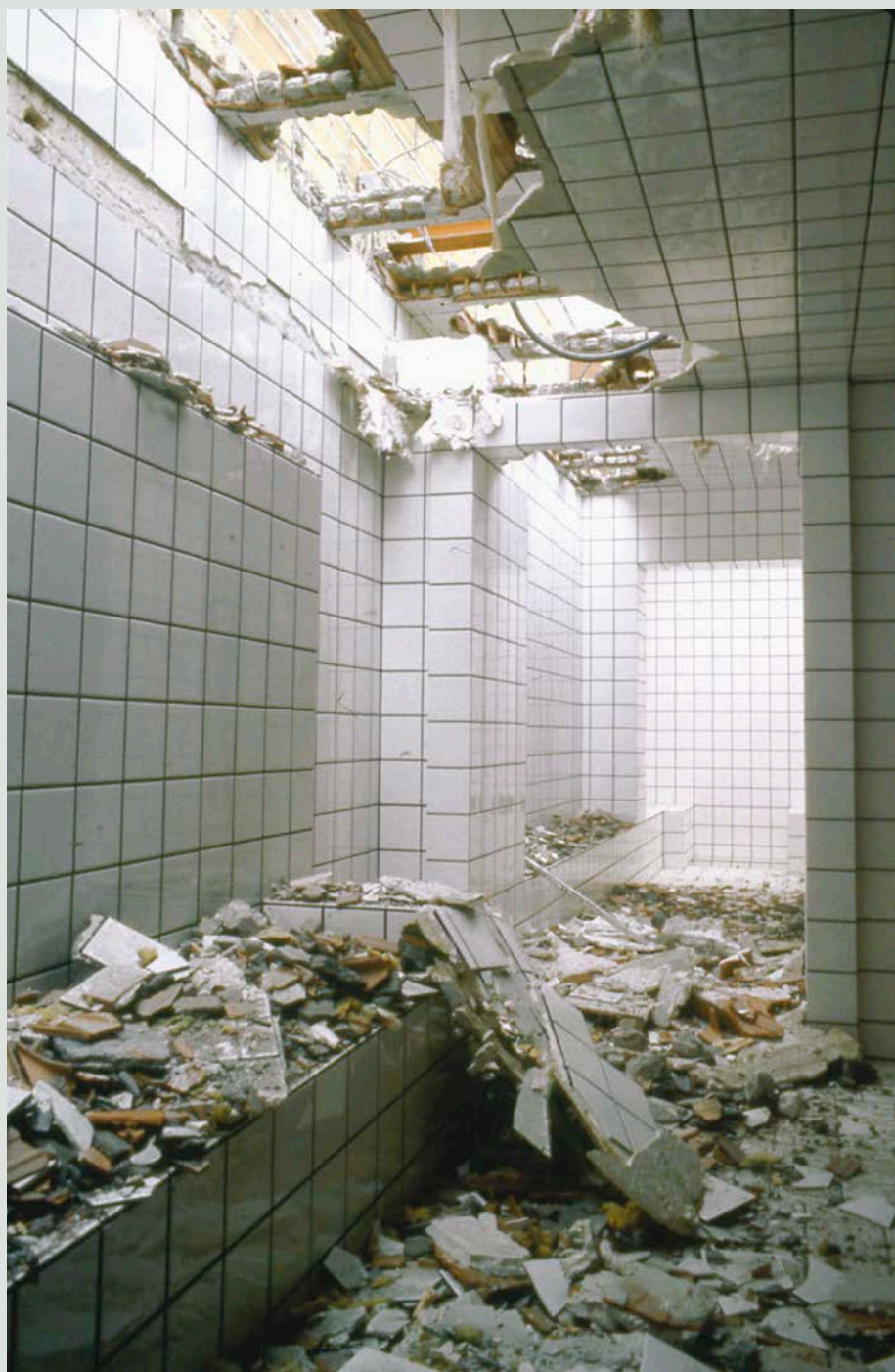
Jean Pierre Raynaud, La Maison de Jean Pierre Raynaud. Démolition de la Maison La Celle-Saint-Cloud (France), mars 1993. Avec l'aimable permission de l'artiste.

J. P. R. Avant d'être artiste, j'étais jardinier. C'est grâce à ce métier que j'ai, pour la première fois, senti la force de la série avec les plantes en culture. La série donne une puissance à ces plantes que l'on ne