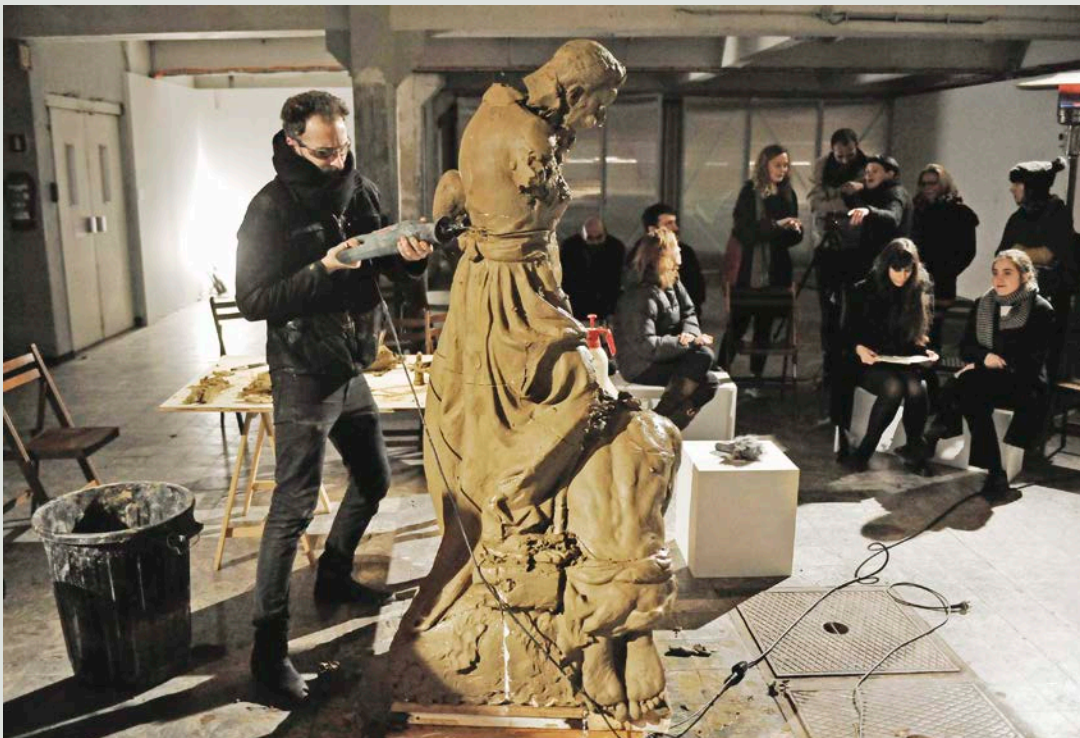
Ibrahim Mahama, Silent Recreations , 2018. Action performative et participative dans le cadre de son exposition On Monumental Silences à la Kunsthall Extra City, Anvers.

Entre détruire les monuments ou les préserver en tant que documents historiques, comme l'indique Michel Melot, « on a le choix entre le sacrilège et l'injure. 14 » Les enjeux sont multiples, car ils dépassent le champ de la préservation patrimoniale, de l'histoire de l'art et de l'aménagement urbain pour s'étendre aux questions de droit à la ville et de justice sociale. Au Canada, un consensus semble cependant émerger depuis les déboulements des monuments états-unis et canadiens en 2017 et 2018 : il est temps d'abandonner la posture antique qui voudrait tout préserver à tout prix pour faire le ménage dans le bric-à-brac des choses et des idéaux désuets et malsains, dans une perspective de réconciliation. Pragmatiquement, il faut admettre que les villes et les monuments qui les habitent n'ont jamais été permanents, tout comme Henri Lefebvre le disait, il y a